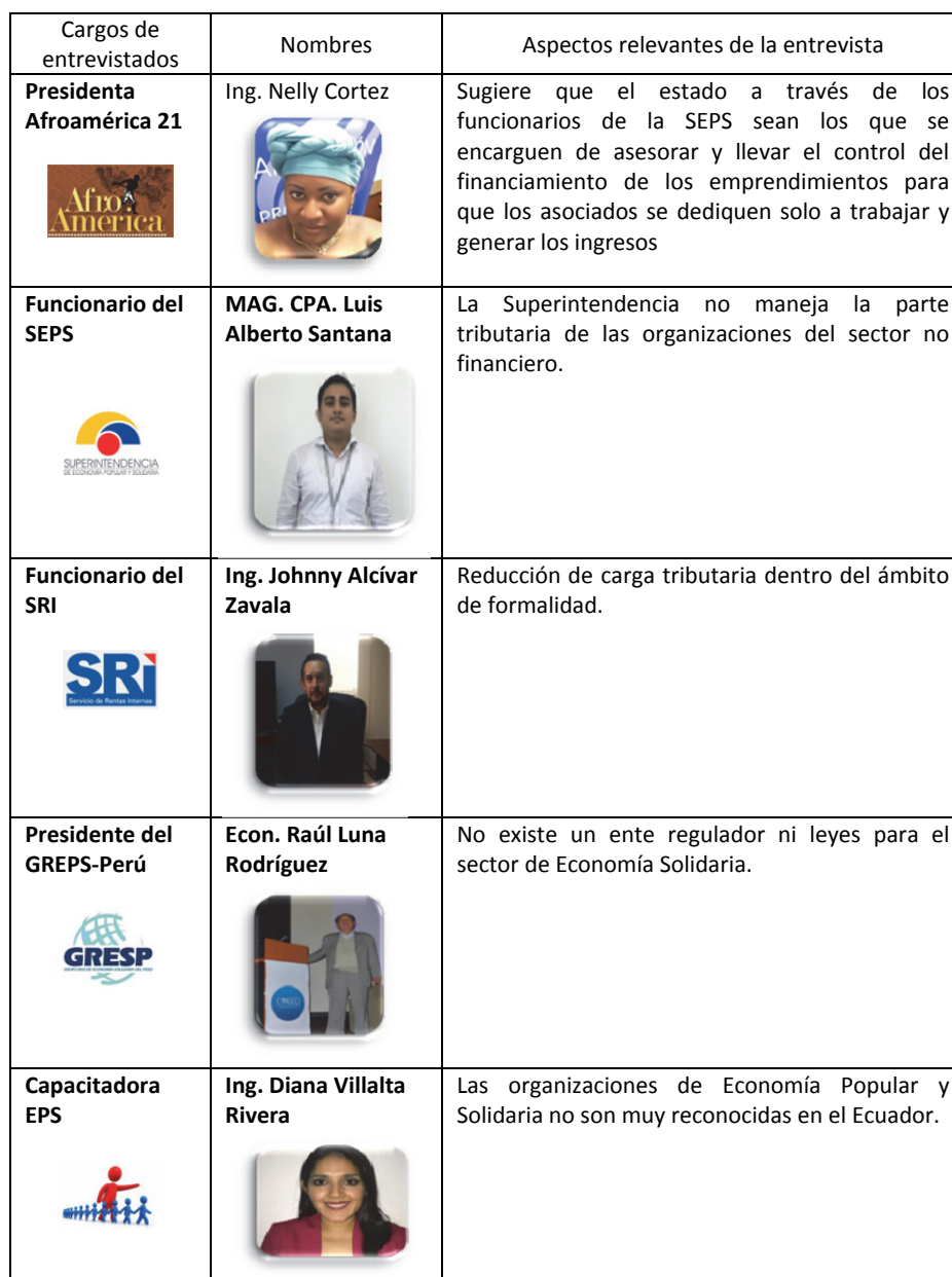
Tabla 3. Entrevistas realizadas