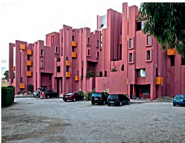
Figura 2. La Muralla Roja (2016) / Figure 2. La Muralla Roja (2016).

Esta singular edificación pertenece a dos modelos arquitectónicos. Por un lado se encuentra dentro de la denominada arquitectura residencial modular donde las viviendas son tratadas como células, las cuales a través de reglas geométricas y modulación son ordenadas en el espacio. Habitat 67 de Moshe Safie en Montreal (Canadá) y La Muralla Roja de Ricardo Bofill en Calpe (Alicante) son dos claros ejemplos de este tipo de arquitectura (Fig. 2). El propio Bofill teorizó sobre este ámbito con su trabajo La ciudad en el espacio , que posteriormente llevo a cabo en diferentes obras como Xanadú o Walden 7 , además de la anteriormente mencionada. 2 Dentro del panorama nacional también destaca la figura de Rafael Leoz y su obra Redes y Ritmos , con los que trabajó su módulo HELE. 3