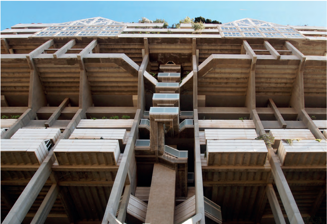
Figura 8. Fachada Norte de Espai Vert, detalle escalera hormigón visto (2016) / Figure 8. North facade of Espai Vert, detail of a fair-faced concrete staircase (2016).