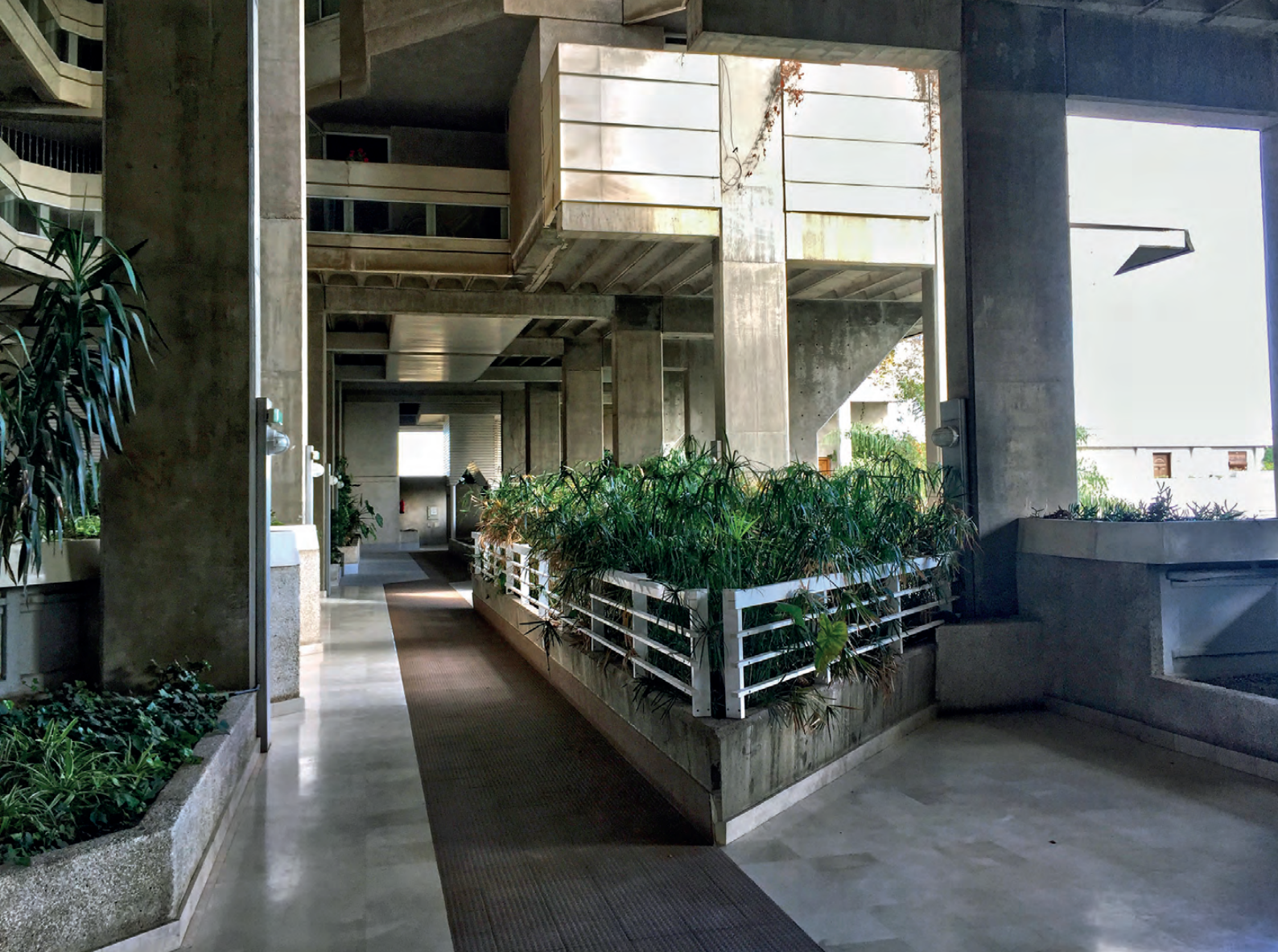
Figura 6. Zonas comunes de Espai Vert (2016) / Figure 6. Common areas of Espai Vert (2016).

se emplearon prelasas de hormigón pretensado de la casa Cibo de 1,2 metros de ancho por 6 metros de largo, que eran situadas en las partes vistas de los espacios comunes de Espai Vert. Por el contrario, en los espacios vivenciales se empleó un sistema de forjado unidireccional con viguetas armadas o de zapatilla hormigonadas in situ. Todo el hormigón empleado en la construcción fue traído directamente de fábrica y los elementos prefabricados fueron seleccionados de un catálogo de productos de la casa Cibo (Fig. 8). En las últimas fases, se emplearon sistemas prefabricados de la casa Prevalesa, como las enormes vigas autoportantes realizadas para salvar los 18 metros de luz, del ahora en bruto futuro centro deportivo del conjunto.