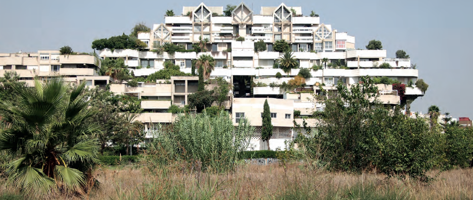
Figura 1. Fachada principal del conjunto Espai Vert (2016) / Figure 1. Main facade of Espai Vert (2016).