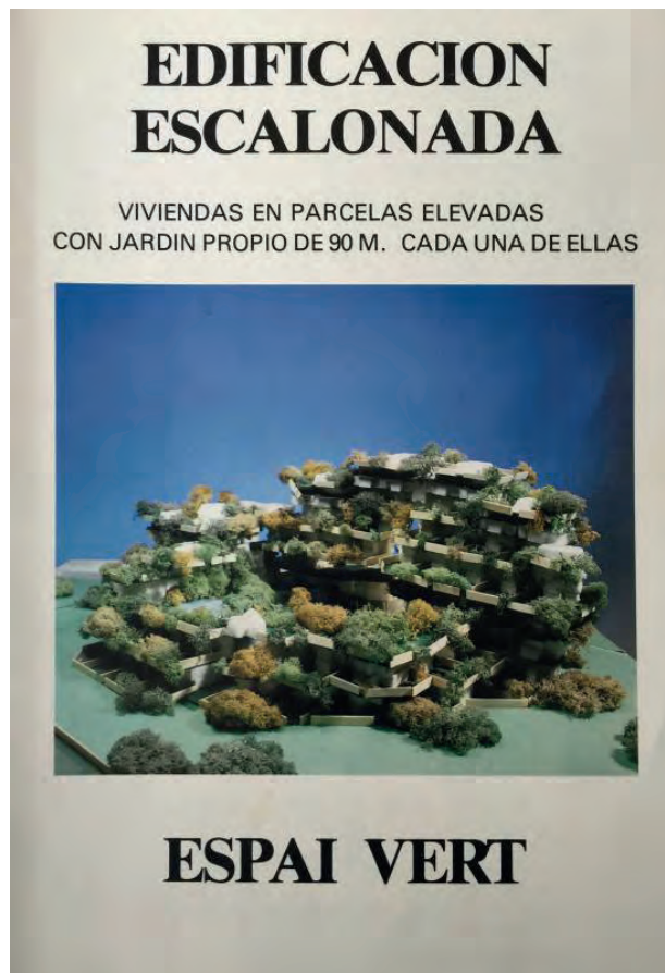
Figura 5. Portada del folleto publicitario de Espai Vert. / Figure 5. Cover of the advertising brochure of Espai Vert.

El tercer punto en el que el autor se detiene para enfatizar su importancia es el sistema estructural empleado en la edificación. Conviene señalar que además del peso propio de la estructura, esta edificación cuenta con un gran volumen de tierra natural en el que se asienta la vegetación. Esto supone que las cargas sean mucho más elevadas que en las de una edificación convencional. Para resolver estas monumentales cargas, muchas de ellas en voladizo, y poder crecer libremente en altura, Antonio Cortés empleó lo que denomina sistema silla . El cual mediante la colocación de dos soportes verticales en paralelo y una jácena que las une y acaba en voladizo, es capaz de soportar todas estas cargas y compensar los momentos que se generan. Es impresionante pasear por las zonas comunes de Espai Vert y poder observar este sistema siendo conscientes de toda la carga estructural que estos soportan.