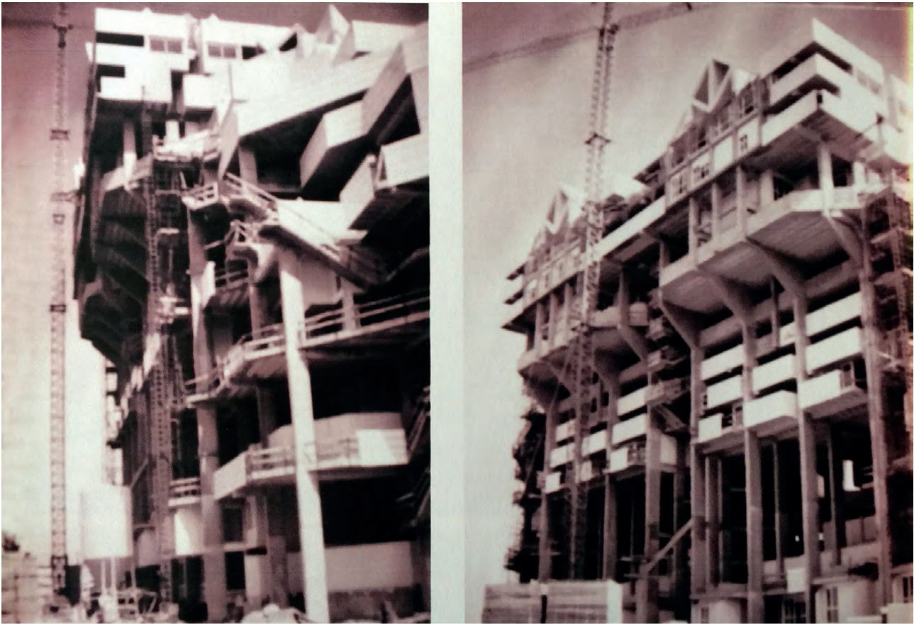
Figura 7. Fotografías de la construcción de Espai Vert. Figure 7. Pictures of Espai Vert's construction.

dilatación sin necesidad de duplicar elementos portantes en uno de sus ejes. Como se ha mencionado anteriormente, el sistema para crecer en altura y poder soportar grandes cargas e incluso espacios con cuatro alturas libres, fue el sistema silla . Para ello situaba dos de los enormes pilares con secciones próximas a un metro en una de sus caras, a una distancia entre sí de 1,5 metros a los cuales unía las jácenas colgantes en voladizo. Este sistema es la base del escalonamiento y del sustento de toda la obra (Fig.9).