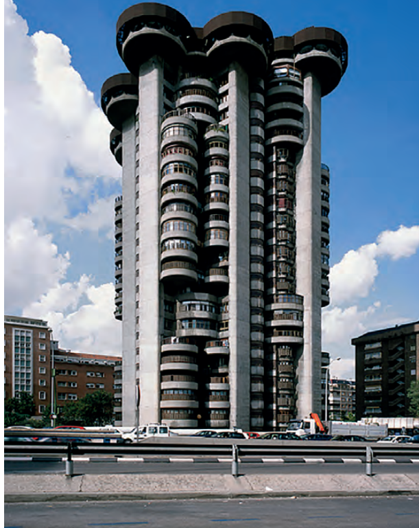
Figura 3. Torres Blancas. Hagen Stier (2010). ©Sosbrutalim / Figura 3. Torres Blancas. Hagen Stier (2010). ©Sosbrutalim.

En los últimos años esta edificación ha visto crecer su importancia en el colectivo arquitectónico. Ha sido objeto de varias exposiciones y visitas al propio edificio organizadas por el CTAV, el trabajo Vips 70 del joven equipo Crearqció, o el artículo “Espai Verd, una