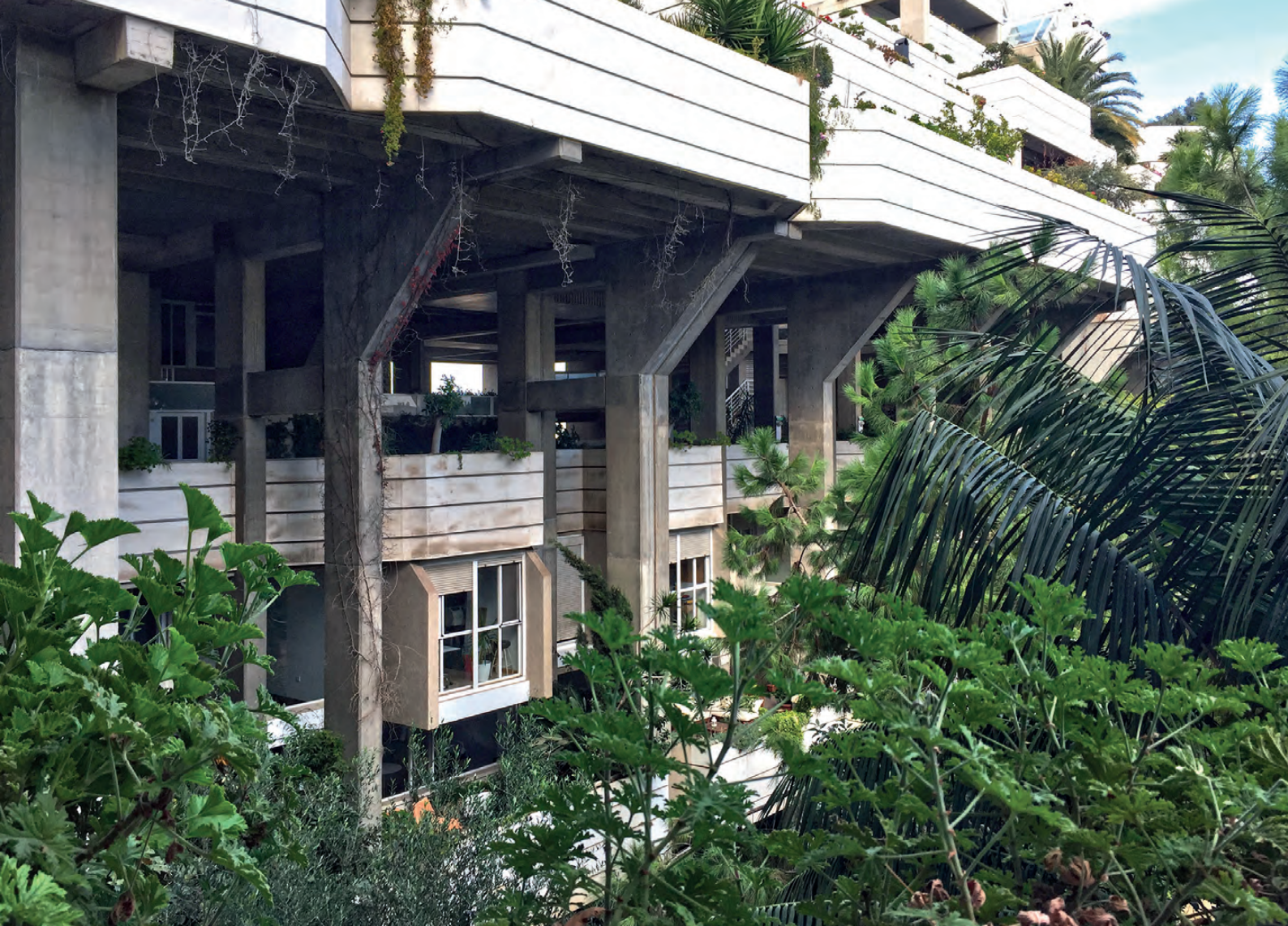
Figura 10. Fotografía del sistema estructural silla. (2017) / Figure 10. Picture of a "chair" structural system (2017).