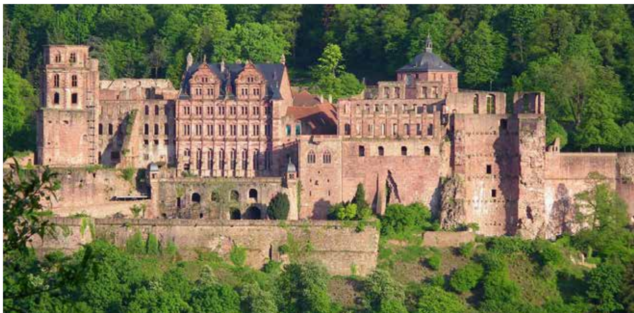
1. Vista del Castillo de Heidelberg** 1. View of Heidelberg Castle**

Arquitecta y profesora / Architect and professor. Università La Sapienza di Roma