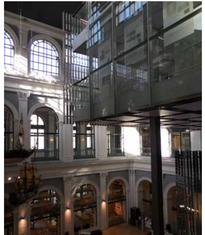
9. Berlín, Neues Museum (2016).