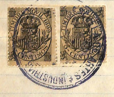
<u>GAMPUS D'ALCO</u> Jesion del 33 de Noviembre 1899