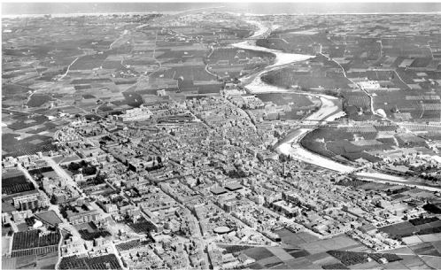
Panoràmica A de Gandia en els 60

Un primer temps, que qualificarem com tardofranquisme, a cavall entre el franquisme i la immediata transició a la democràcia, té un especial tarannà polític. Havia brollat el maig del 68 i mort Carrero Blanco el 73. De la Corporació formaven part alguns rellevants membres de la societat civil, encara que anomenats pel governador de torn, ja tenien pocs lligams amb el «Movimiento Nacional», el que facilità la transició política.