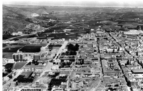
Panoràmica B de Gandia en els 60

Gandia passa de 41.565 habitants a 52.390 en deu anys. Dels més de 10.000 nous habitants, 4.000 són immigrants, la majoria dels pobles del voltant (Bañuls 1985 i 1986) i quasi tots vivien ja del sector serveis.