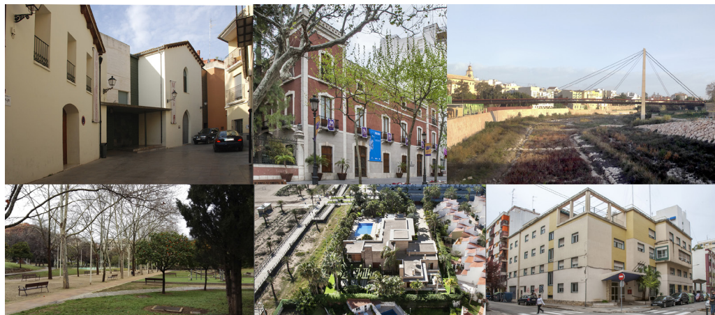
Església (1984) i Antic Hospital (1990) I. Lafuente i F. Mut