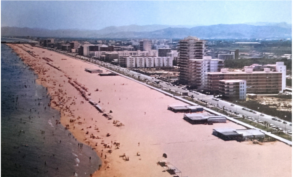
Panoràmica de Platja de Gandia en els 60

democràtica (1983-1987), ja amb Salvador Moragues , no comença a veure's el canvi de prioritats que farà de la ciutat construïda, de la qualitat de vida als barris i de l'urbanisme disciplinat uns objectius explícits de govern. «L'entrada de les noves corporacions democràtiques produeix l'esclat de dotacions públiques llargament reivindicades en educació, sanitat, cultura, zones verdes i parcs públics, així com la implantació de la disciplina urbanística i l'acotament d'edificabilitats i plusvàlues» (Peñín 2015: 31). L'arquitectura anava al seu pas, depenent de la marxa econòmica i dels estalvis locals, cada volta més lligats al turisme i al comerç i menys a la taronja i als productes agraris.