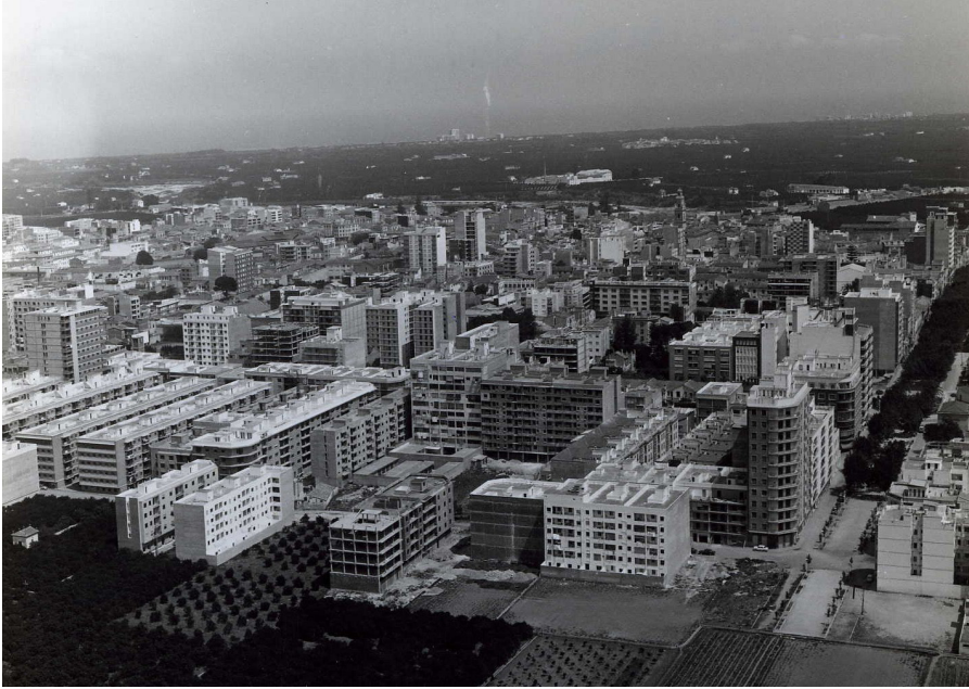
Panoràmica de zona Oest en obres

(que no en lloguer), nou paradigma de l'època que atorgava al seu poseïdor un estatus socioeconòmic reconegut.