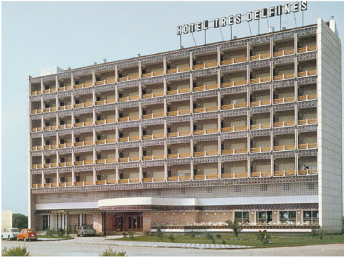
Hotel Tres Delfines 1971, transformat en 1973 en apartaments, M.Lopez Mateos