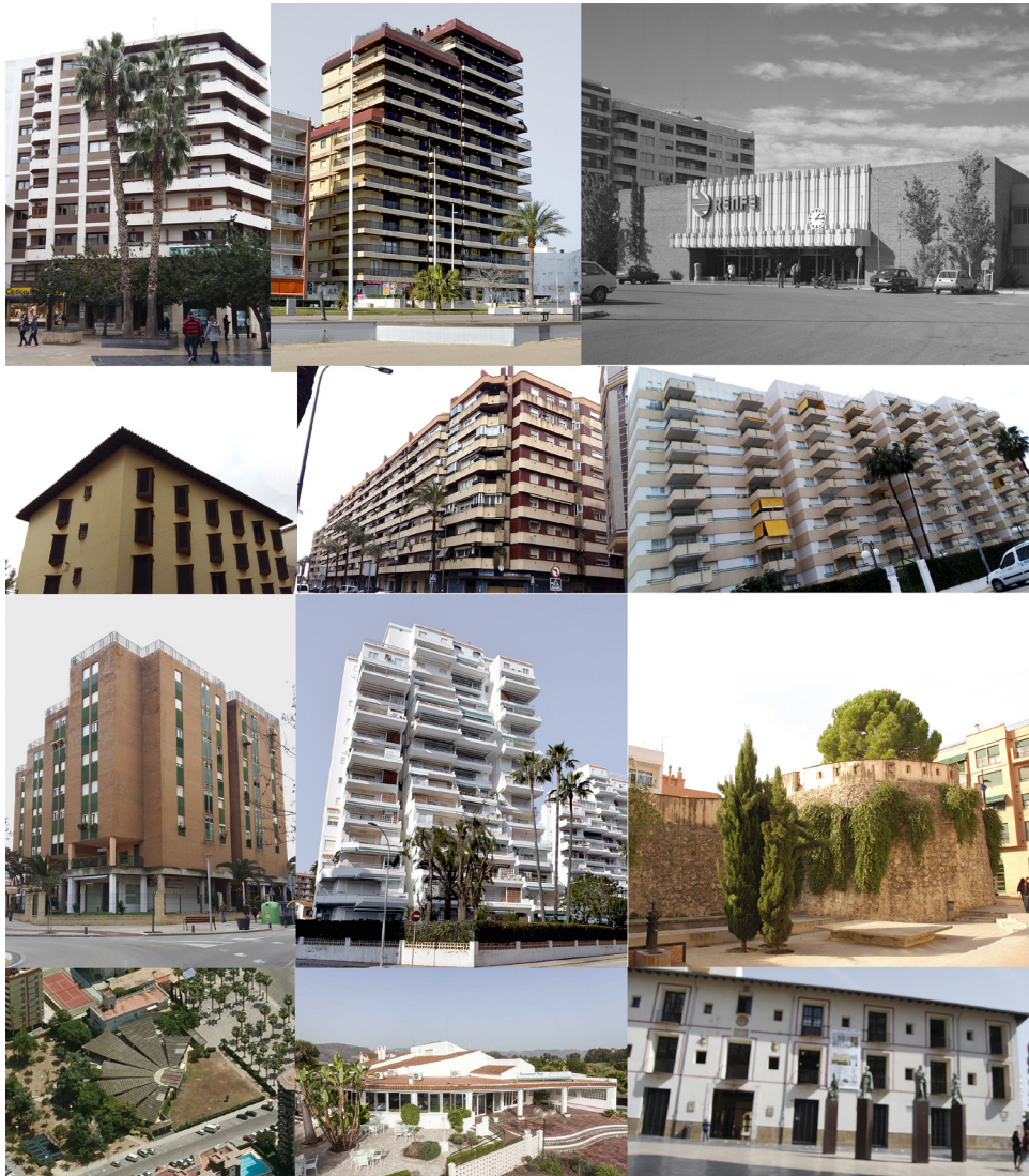
Edifici Leandro Calvo 2 (1975) P. Sentieri