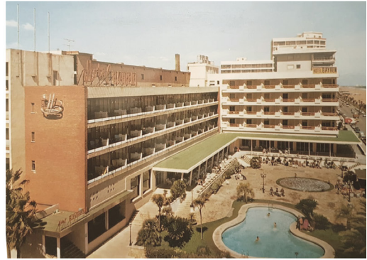
Ampliació Hotel Bayren 1974

Allí, l'edificació aïllada serà cada volta més alta, més densa i tindrà botigues en algun dels seus baixos; es crearan uns pocs centres d'oci de temporada (Aquarium), i conformarà la imatge de la nostra platja, com tan bé relatava en els 80 Joan Fuster 28 . Amb tanta debilitat estructural, la gran crisi del 2008-2014 serà també la seua crisi.