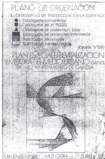
PERIMMU 1984 Lafuente, F. Mut, A. Zurilla

Quan arribem al 1985 38, Gandia ha pegat un bot demogràfic i econòmic. Ha canviat la seua imatge i encara canviarà molt més durant el període posterior, la «dècada prodigiosa» que diu Burriel. Vindrà una gran inundació en 1987 que aflorarà una necessitat d'infraestructura, sobretot a Beniopa. A nivell social s'ha consolidat la democràcia (colp de Tejero, 1981), afiançat la comarca, aparcat la desafortunada «batalla de València» amb l'Estatut d'Autonomia (1982) i la Llei d'Ús i Ensenyament (1983); tenim govern propi i es normalitza l'ús del valencià. També apareixen les diferències entre els col·lectius que encapçalaren la transició des dels 70 (Soria 1990; Novell, Muñoz 1990; Borja, Mora 2001; Peñín 2007: 78; Alonso 2011; Alonso, Cremades 2013).