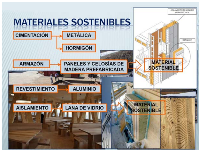
Fig. 5 Construcción Sostenible. Ejemplo de trabajo práctico 1. Estudio de materiales

Como primer trabajo cada grupo elige un edificio que disponga de Certificación de Sostenibilidad o un reconocimiento como tal, para estudiar todos los elementos diferenciadores respecto de un edificio convencional. Se realiza un análisis del diseño arquitectónico sostenible, de los sistemas constructivos, materiales e instalaciones (figura 5), sistemas pasivos, integración en el entorno, empleo de energías renovables... analizando sus puntos fuertes y sus debilidades, tanto en la fase diseño como en el proceso de ejecución y en su mantenimiento, teniendo en cuenta su tipología de uso.