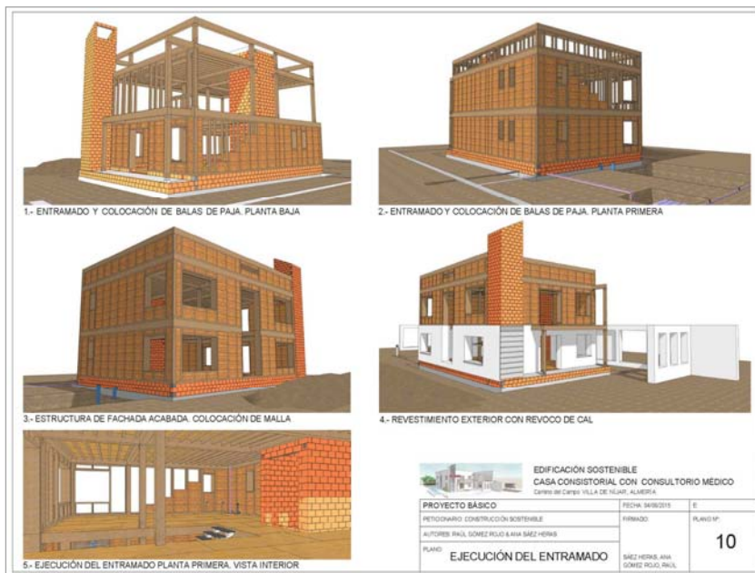
Fig. 6 Construcción Sostenible. Ejemplo de trabajo práctico 2. Desarrollo constructivo

Como segundo trabajo se entrega a los alumnos un proyecto de edificación convencional para que apliquen los criterios y conocimientos adquiridos en la asignatura y lo transformen en un proyecto de edificación sostenible, figura 6. Para ello pueden modificar todos los elementos constructivos (estructura y cimentación, fachada, cubiertas, particiones, carpinterías, revestimientos...) y las instalaciones, emplear sistemas pasivos (Muro Trombe, tubos canadienses, muro parietodinámico, chimenea solar, etc..) (Neila, 2014, Rodríguez, 2002), y actuar en el entorno que le rodea, ya sea con vegetación o con sistemas de soleamiento. La única limitación es no variar la distribución interior de la edificación, ya que no es objeto de la asignatura.