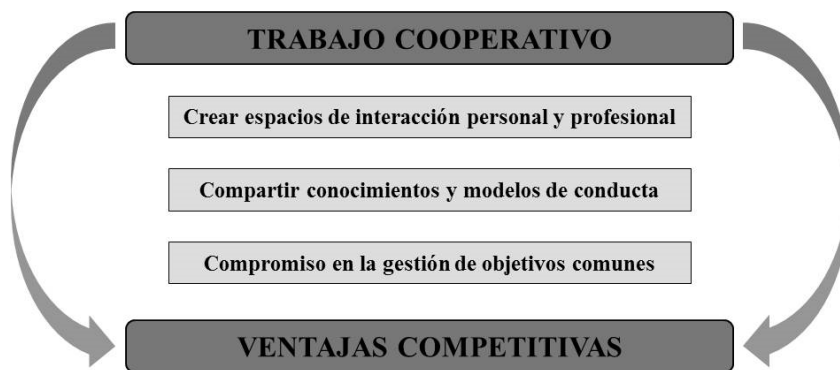
Figura 4. Ventajas del Trabajo Cooperativo en grupo

El trabajo cooperativo en grupo es una metodología educativa apropiada para desarrollar las habilidades personales de los alumnos, al mismo tiempo que se fomenta la colaboración interactiva con otros compañeros para realizar proyectos y trabajos conjuntos. Figura 4.