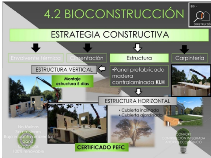
Fig. 2 Construcción Sostenible. Ejemplo de exposición de trabajo práctico 1