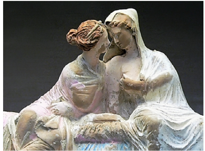
Fig.3. (izq.) https://st11.ning.com/topology/rest/1.0/file/get/1374613289?profile=original "(the Two Goddesses Demeter and Persephone seated in a cart; ca. 600 BC, made in Korinth and found in Thebes, Hellas. Now in the British Museum...)"