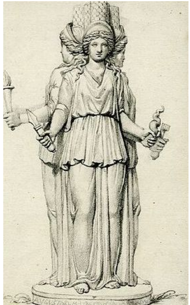
Fig.5 Hécate triple https://upload.wikimedia.org/wikipedia/commons/5/5d/Hecate.jpg cropped the british museum Unknown author public domain Creado el: 9 de octubre de 2014