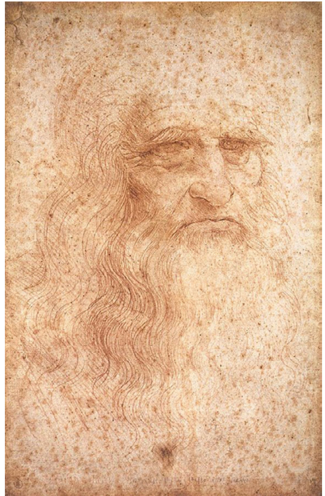
Fig.1. https://upload.wikimedia.org/wikipedia/commons/3/38/Leonardo_da_Vinci_-_presumed_self-portrait_-_WGA12798.jpg c. 1510-1515. 19 / 03 / 2023