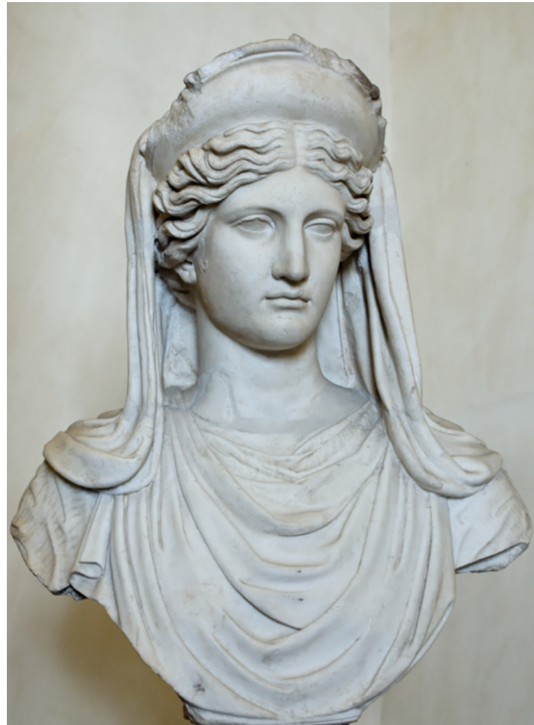
Fig.2. https://upload.wikimedia.org/wikipedia/commons/1/18/Demeter_Altemps_Inv8596.jpg Demeter. Marble, Roman copy after a Greek original from the 4th century BCE

Deméter-Perséfone (cf. Kerényi 2004) son un símbolo de la unidad —neutralización— de la dualidad —fragmentación—: vid. este concepto plasmado en las siguientes [Figs. 3 y 4]: