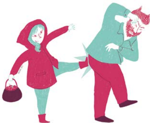
Paulapé. ¡Quita, bicho! para Pikara magazine.

para defender la normalización de la lengua valenciana como herramienta de comunicación, como un mecanismo de cohesión social y como patrimonio cultural llevadas a cabo desde el fin de la dictadura —ya sea por parte de las instituciones públicas, en cumplimiento del Estatut d'Autonomia de 1982, ya sea por iniciativa privada de empresas, plataformas de la sociedad civil o del activismo personal— que usan la ilustración gráfica y el cómic para difundir esta reivindicación histórica. Desgraciadamente, la lengua valenciana continúa, a día de hoy, sufriendo ataques, discriminaciones y la estigmatización inherente a su instrumentalización política.