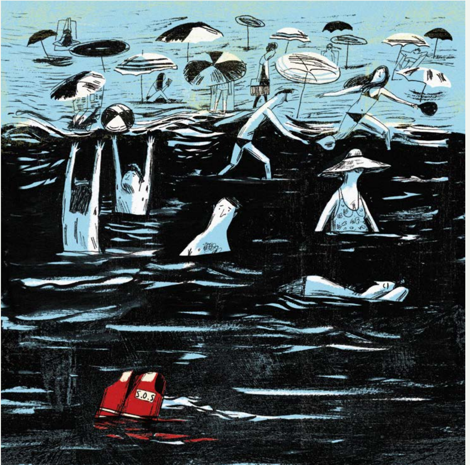
César Barceló para la exposición Refugi il·lustrat, APIV.