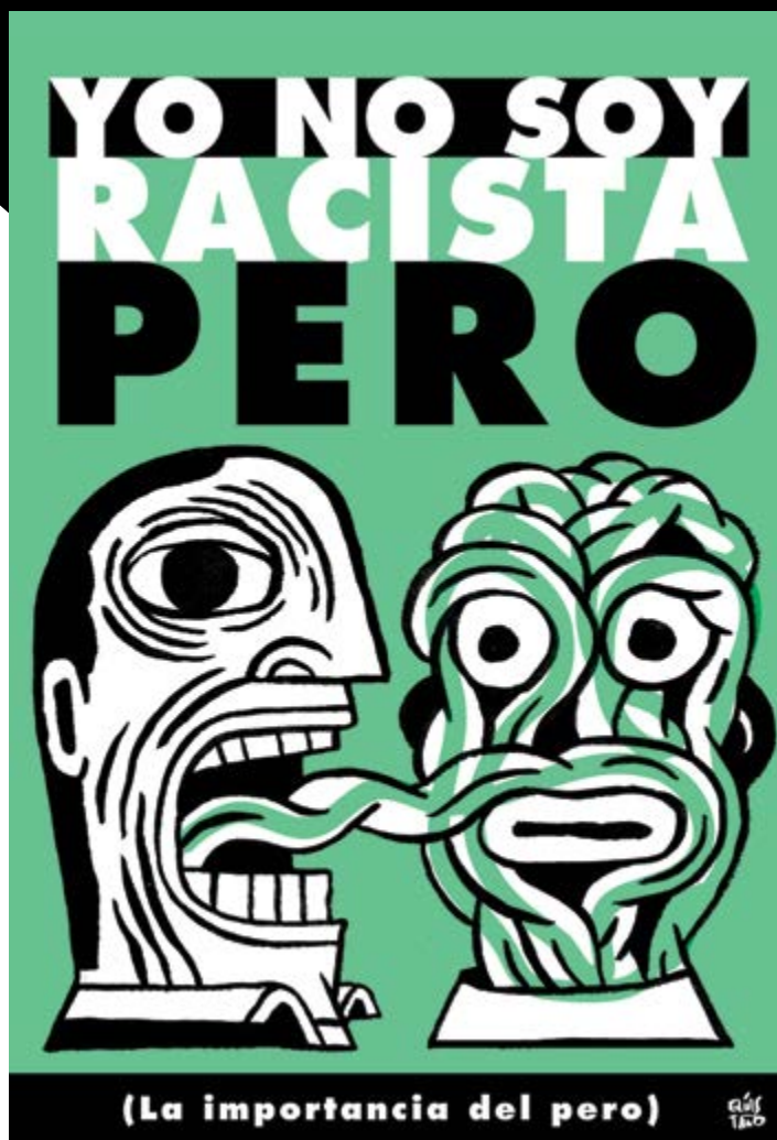
Eliás Taño. Yo no soy racista pero para Centro de Atención a la Inmigración.

La normalización de las diferentes identidades de género y de la orientación sexual y afec-