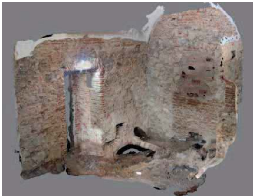
Fig. 7: Levantamiento fotogramétrico. Estudio Cruz y Rueda arquitectos

Por otro lado, es importante tener en cuenta que el profesor, en las asignaturas que hagan uso de estas tecnologías, no debe convertirse nunca en un “técnico de programas” que lo único que hace es explicar paso a paso la aplicación de una herramienta. Es importante hacer comprender al alumno que el manejo del programa no es lo exclusivamente importante: lo fundamental es comprender el objetivo último del uso de este material de trabajo que es, principalmente, la búsqueda de la precisión de cara al levantamiento documental y al diagnóstico arquitectónico. Que el trabajo sea útil no sólo