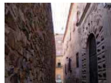
Fig. 2: Superficie irregular de una fachada de mampostería en Cáceres.

plano virtual tangente a los elementos salientes de la cantería, mampostería o enlucido, despreciando resaltes excesivos.