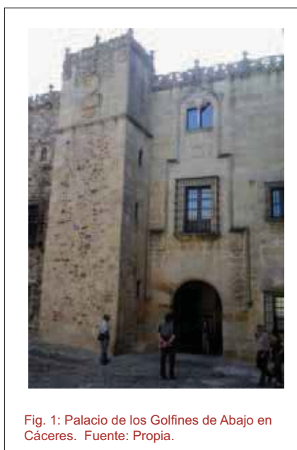
Fig. 1: Palacio de los Golfines de Abajo en Cáceres.

Para este ensayo acotamos el panorama a espacios de dimensión limitada (de 100 a 500 metros cuadrados), en una o dos plantas, que puedan afrontarse por una o dos personas en un tiempo razonable (una o dos jornadas de trabajo de campo) y con medios asequibles para estudiantes de Edificación o Arquitectura.