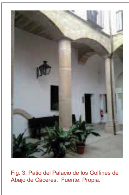
Fig. 3: Patio del Palacio de los Golfines de Abajo de Cáceres.

cala), que remite a la precisión deseada. Procedimiento análogo se seguiría a distintos niveles de altura, señalando plantas u organizaciones espaciales específicas, tanto del conjunto del edificio (dobles espacios, diversas capas de cubierta) como de parte de él (sótanos, entreplantas, torres).