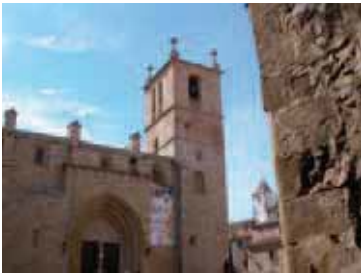
Fig. 5: Posicionamiento de estación total en torre cercana.

mente indispensable en cubiertas no accesibles. En primer lugar, a partir de una estación en cota superior a la medida para tomar los puntos notables de la cubierta. Y en segundo lugar para relacionar el punto de estación precedente con otros sobre el suelo que permitan tomar puntos notables de la fachada.