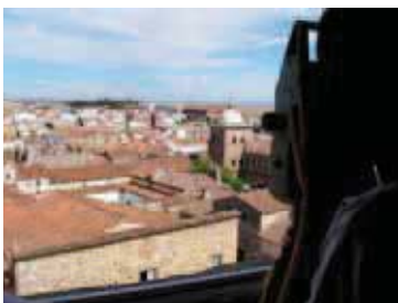
Fig. 6: Toma de datos con estación total desde torre cercana.

Se ha mencionado la cámara fotográfica. Para utilizarla con precisión requerirá su calibrado, corrigiendo las distorsiones geométricas de la imagen, asequible con software libre (9).