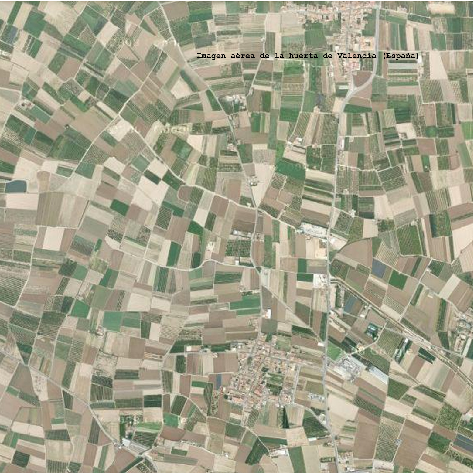
Imagen aérea de la huerta de Valencia (España)