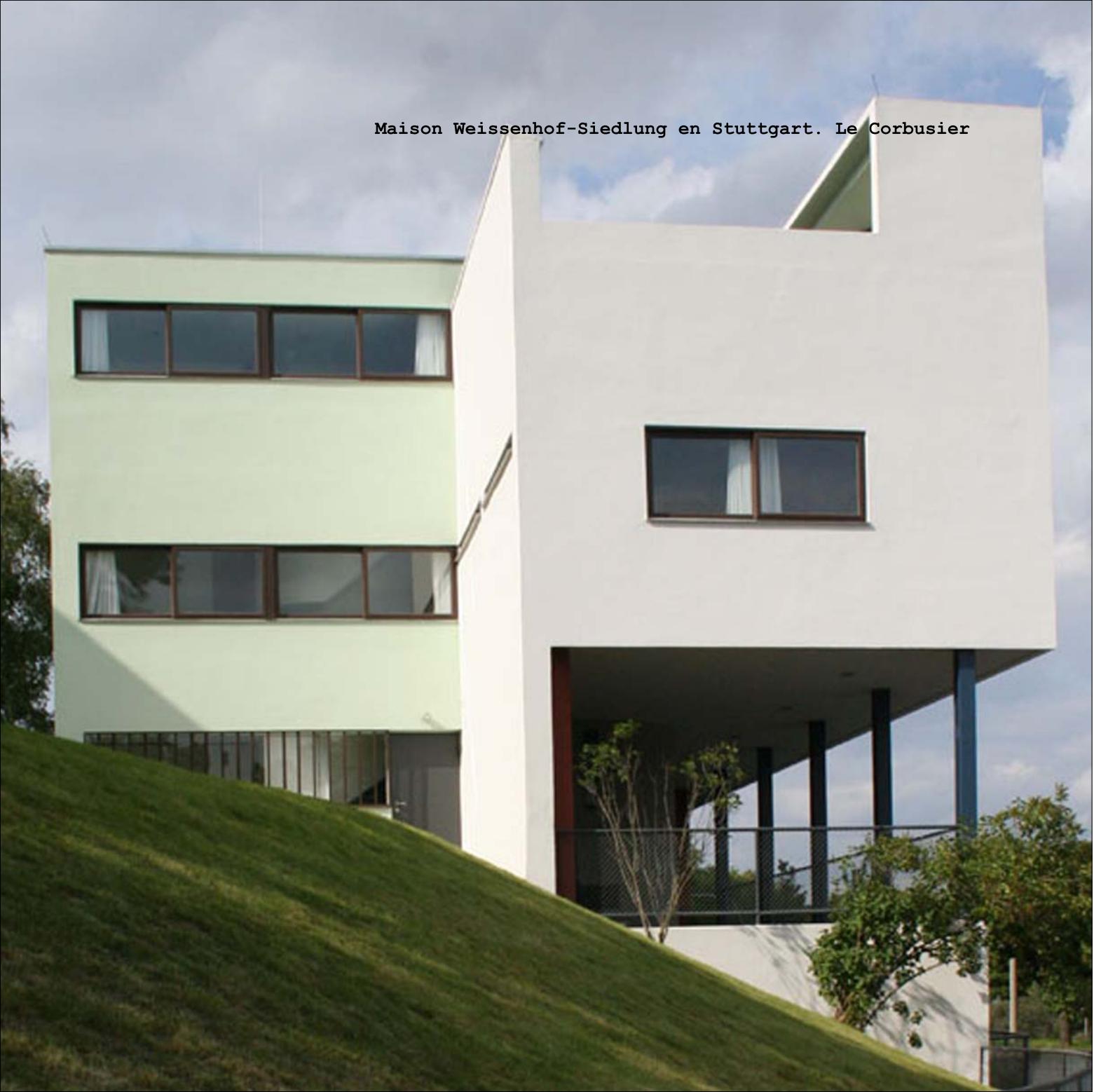
Maison Weissenhof-Siedlung en Stuttgart. Le Corbusier