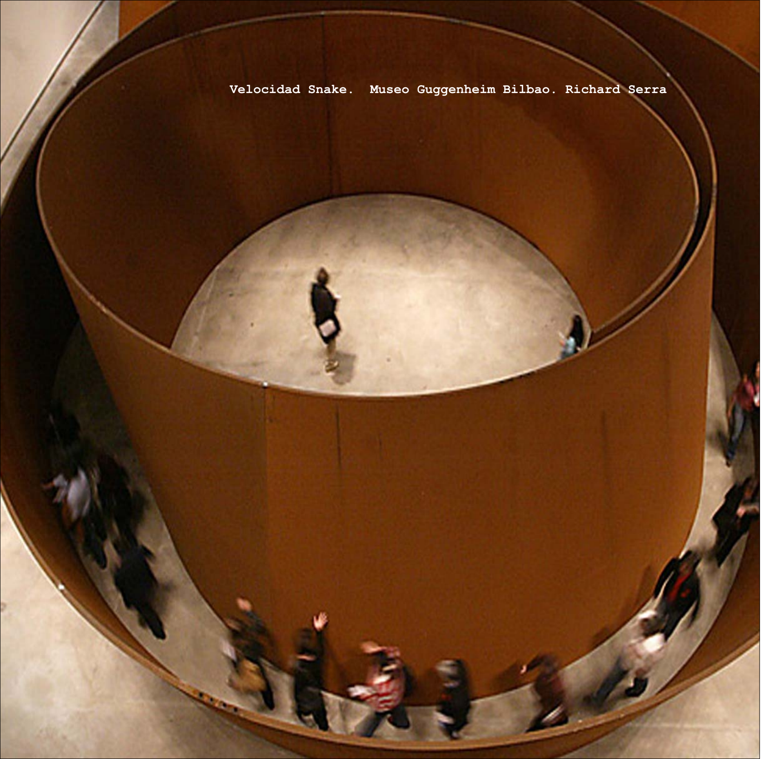
Velocidad Snake. Museo Guggenheim Bilbao. Richard Serra