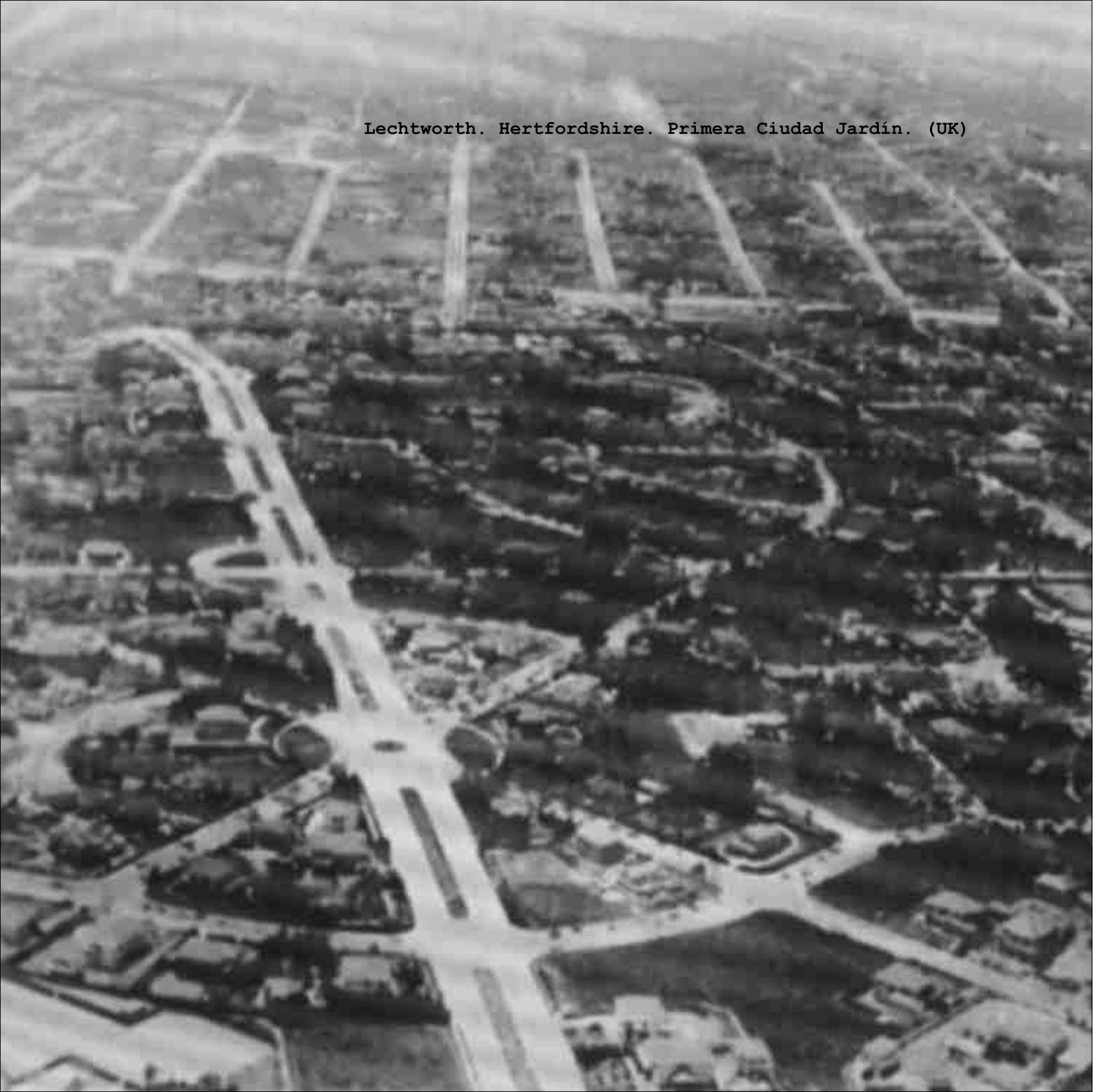
Lechtworth. Hertfordshire. Primera Ciudad Jardín. (UK)