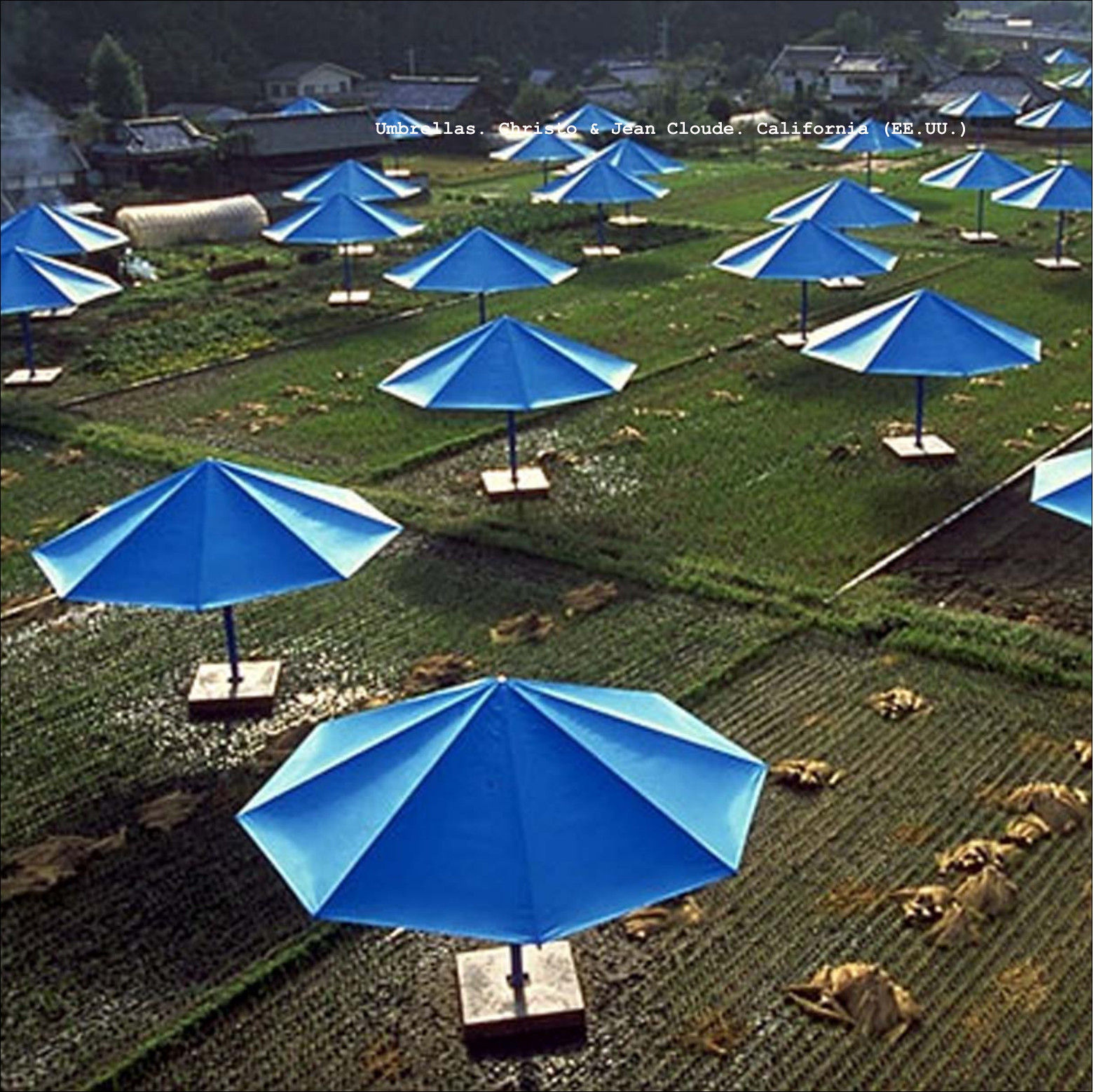
Umbrellas. Christo & Jean Cloude. California (EE.UU.)