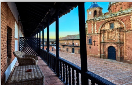
Ilustración 3. Fachada Hospedería Santa Elena