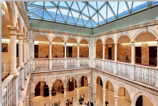
Ilustración 5. Interior Hospedería Hotel Spa Palacio del Infante Don Juan Manuel