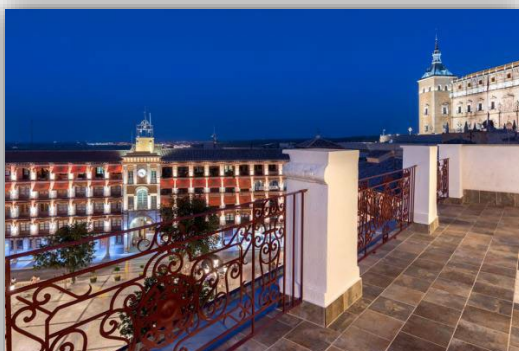
Ilustración 1. Hospedería Hotel Boutique Adolfo.