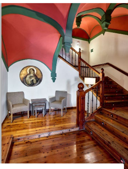
Ilustración 6. Interior Hospedería Convento del Giraldo