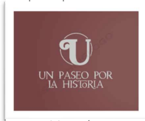
Figura 1. Logotipo del producto turístico creado: "Un paseo por la historia"

2. Diseño y planificación del producto interpretativo. Fase en la que se traza el itinerario de la visita teniendo en cuenta la distribución de los espacios y de los tiempos, se redacta el guion interpretativo, se diseña el logo del producto creado, así como los distintos soportes y la cartelería, se hace una estimación de los costes asociados al proyecto y se determina el precio de la entrada de la visita para clientes no alojados.