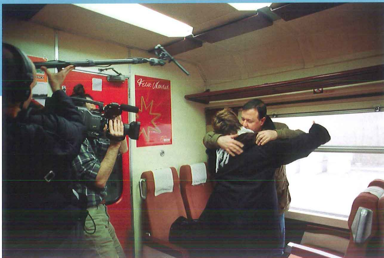
Veinte años no es nada