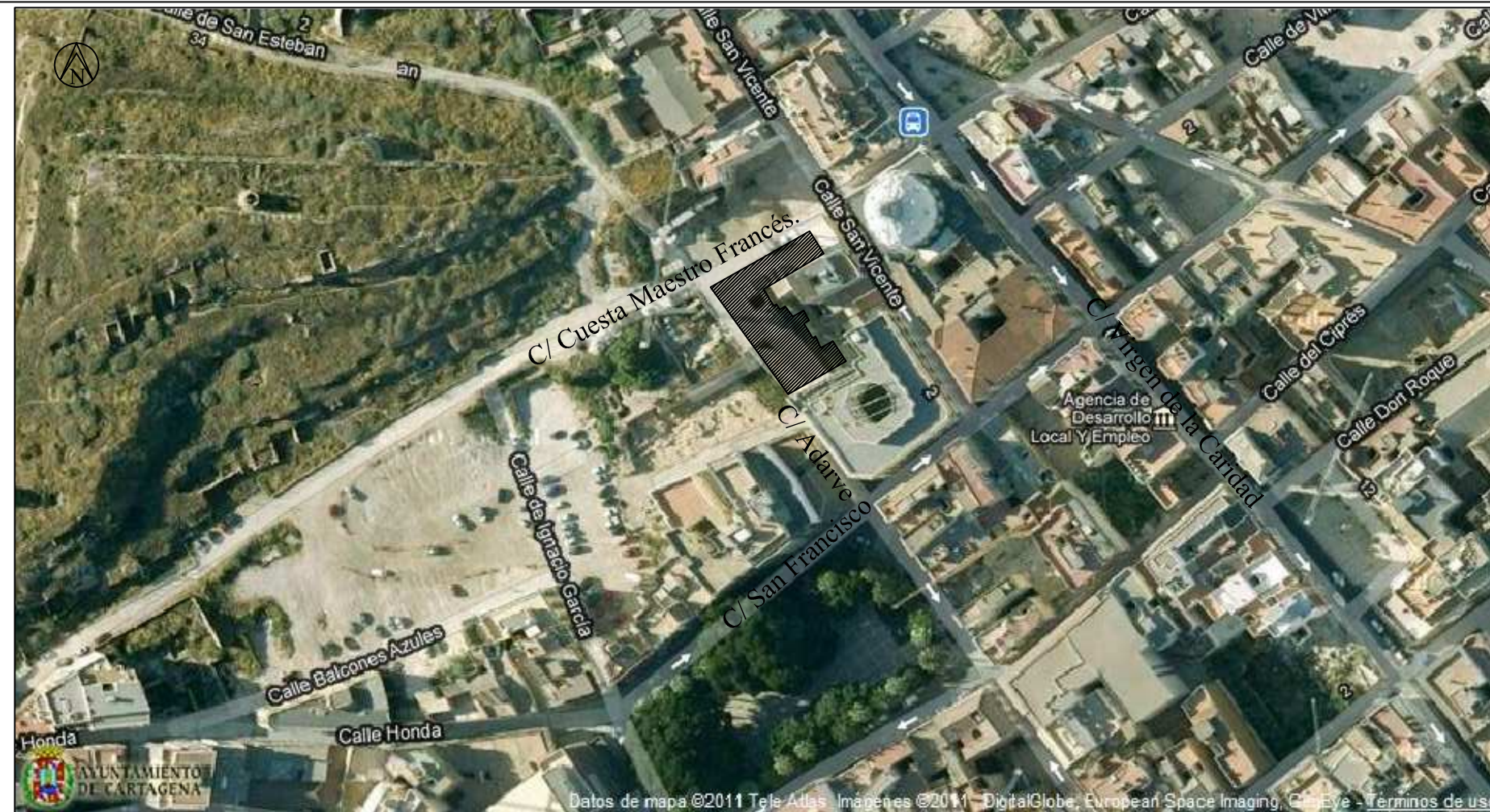
Plano de situación. E: 1/5000