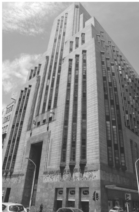
Foto 1. Mutual Building, Ciutat del Cap, Sudàfrica.

en què ha estat produïda. Per posar un exemple podem citar la Grècia clàssica, on el fort sentiment de col·lectivitat va propiciar l'aparició, propagació i consolidació d'un conjunt de tipologies on només canviava la mida i poc més. Ben al contrari, l'auge del capitalisme a principis de segle xx va propiciar l'individualisme, la voluntat de ser original, de sentir-se admirat i, fins i tot, envejat. Els edificis d'aquell període es convertirien en autèntics mitjans per mostrar a la societat el poder i els trets diferencials dels estats i les empreses que els van erigir. Podríem citar centenars d'exemples amplament coneguts, per això en comentarem un que no ho és tant. El Mutual Building va ser erigit el 1939 per la South African Mutual Life Assurance Society a Darling Street, el mateix carrer on només a un bloc de distància trobem l'ajuntament de Ciutat del Cap (Sudàfrica). La totalitat de l'edifici reflecteix de manera òbvia el sistema de valors del seu temps, però especial atenció mereix la seua porta principal. Les seues dimensions megalòmanes i el refinament de la seua ornamentació ens parlen clarament de la supremacia de la companyia en el negoci de les assegurances al continent africà en aquell període.