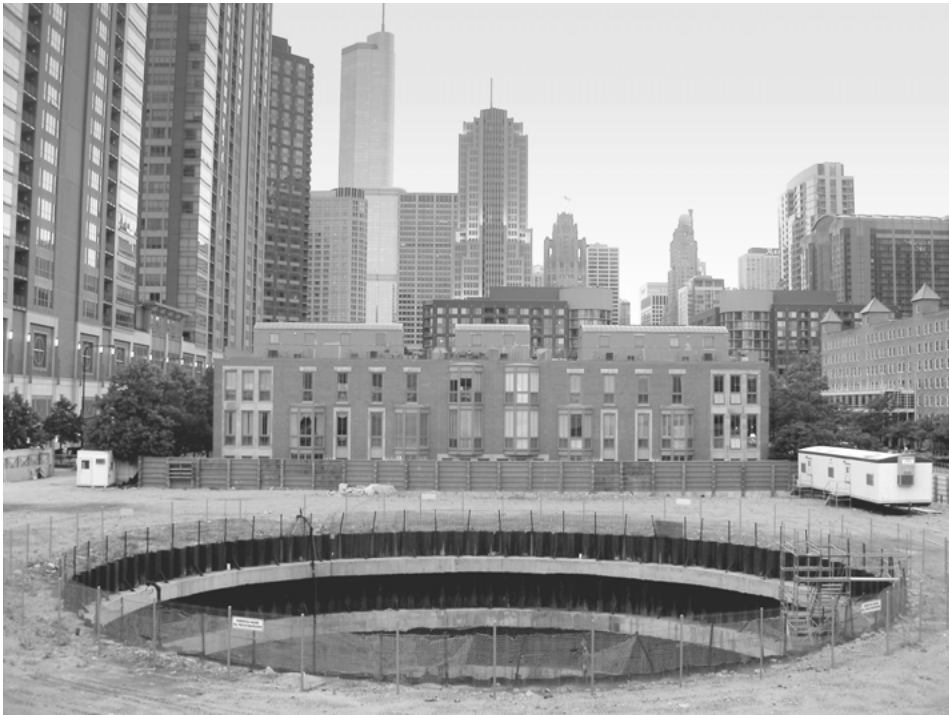
Foto 3. Obres del Chicago Spire abandonades després de la construcció dels fonaments i els murs de contenció dels soterranis al maig de 2010.

van adquirir una rellevància internacional aclaparadora. Una anàlisi detallada de la seua obra introdueix sovint el dilema de si la societat va evolucionar al caliu de l'arquitectura que ell va gestar o si és la seua arquitectura qui va evolucionar per adaptar-se a la societat que ell va concebre.