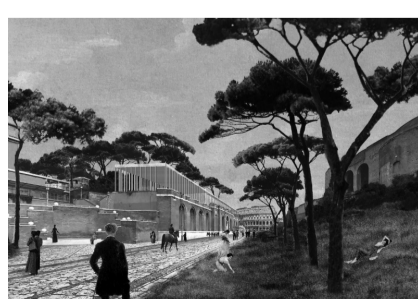
FIG. 2 v