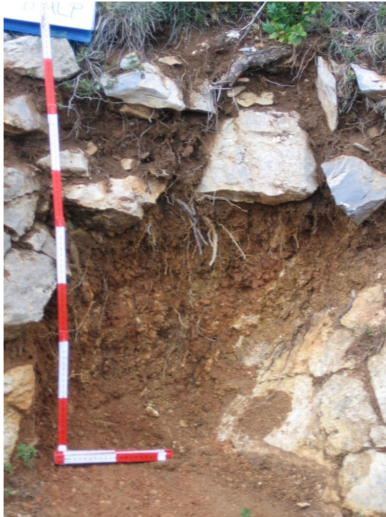
Imagen 1: Perfil de un Orthent (Lleida)

Orthents: Son otros Entisoles que se han formado sobre superficies erosionadas recientemente y que no han evolucionados más debido a que su posición fisiográfica conlleva una gran inestabilidad del material parental (figura nº 1). Los Orthents se encuentran en cualquier clima y bajo cualquier vegetación. Los suelos formados con material transportado por el hombre para disminuir las pendientes del lugar realizando abancalamientos o terrazas para poder cultivar en laderas (y que conocemos con el nombre de "transformaciones") son clasificados dentro de este suborden.