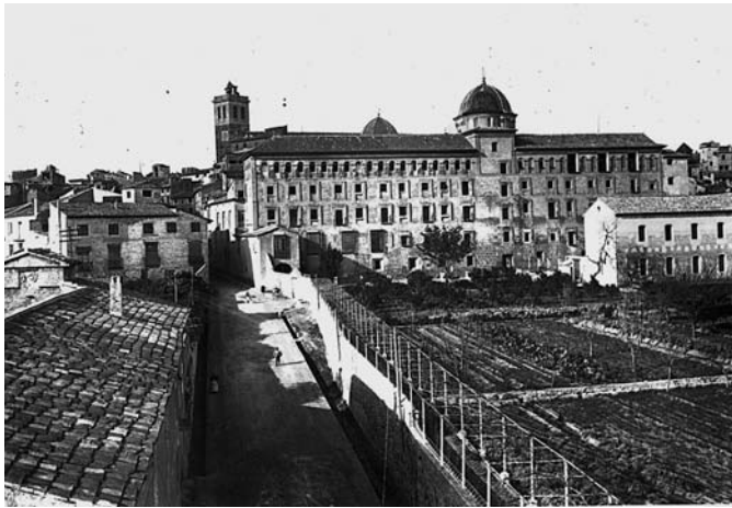
Fig. 5. Vista general del conjunto hacia 1930 (fotografía AHMS).