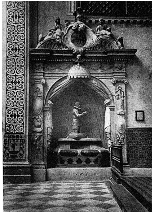
Fig. 4. Sepulcro desaparecido de Don Pedro Miralles.

Por su parte, el imponente cuerpo de residencia era terminado también en las primeras décadas del siglo XVIII. 46 Su fachada a las antiguas huertas, protagonista de las vistas históricas de la ciudad 47 estaba coronada por una galería de arcos de medio punto entre pilastras toscanas, habitual en la arquitectura colegial , en una tradición iniciada en la arquitectura religiosa por las fachadas del colegio del Patriarca. En estas fechas debe estar cons-