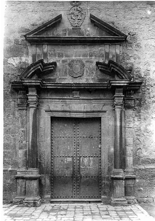
Fig. 6. Portada de la iglesia hacia 1930.

abriendo huecos a la fachada a las huertas 48 y comunicadas por un corredor que en primera planta permitía acceder a las tribunas de los laterales y pies de la iglesia. El progreso de la construcción se verá favorecido por las licencias otorgadas por la ciudad a los jesuitas autorizando a extraer piedra de las canteras de los Algezares y del Montecillo de San Blas, 49 otorgadas en los años 1733 y 1735 respectivamente. El buen ritmo de las obras permite que en 1737 ya se hayan construido las nuevas sacristía y portería, lo que indica también que el claustro debe estar ya finalizado en estas fechas. 50 La actividad constructiva continúa en los