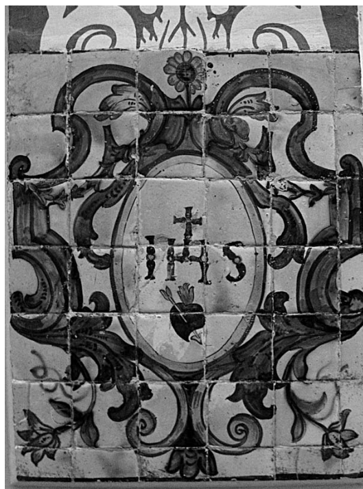
Fig. 3. Panel cerámico del crucero de la iglesia.

la nueva iglesia situado en la parte trasera del conjunto. En los años siguientes el principal problema será el mal estado estructural de la capilla mayor de la nueva iglesia, hasta el punto de que el padre provincial Matías Borrull llega a recomendar en su visita de septiembre de 1687 separar el ámbito de la cabecera de la nave mediante un tabique ante el peligro de que la estructura colapsase. 24 El problema continúa sin resolverse aún en el año 1694, momento en que los padres