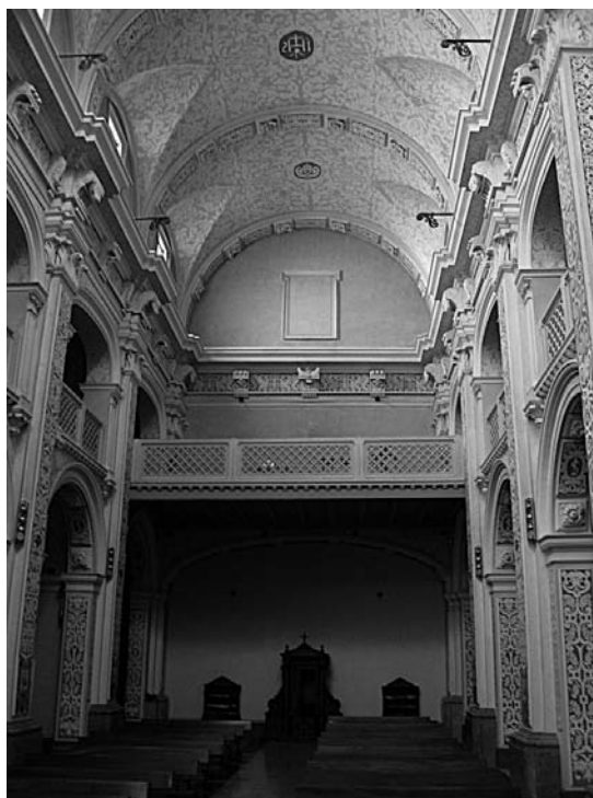
Fig. 1. Interior de la nave de la iglesia.

La nueva iglesia presentaba una planta uninave sin crucero, testero plano y capillas comunicantes, habituales en la arquitectura eclesial valenciana durante el siglo XVII y presentes en ejemplos cercanos como las parroquiales de Vistabella, La Jana o Traiguera. 21 Hasta la fecha se ha creído que en este momento acaba la construcción del templo en su totalidad con el crucero cupulado existente en la actualidad, lo que la convertía en una de las primeras iglesias con planta contrarreformista o jesuítica dentro de la arquitectura valenciana. Sin embargo, las nuevas noticias sobre la ejecución