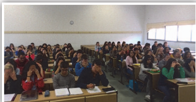
Figura 4. Estudiantes del Grado de Enfermería en escucha discriminativa.