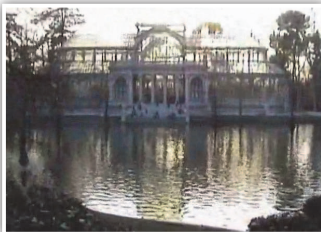
Figura 6. Fotograma de Obertura para un paisaje urbano (2002) de Enrique Igoa

Enrique Igoa, Profesor y Compositor, del Real Conservatorio Superior de Música de Madrid, aportó una obra multimedia suya para nuestro conocimiento, que reflexiona ampliamente sobre la naturaleza de los sonidos urbanos en Madrid: Obertura para un paisaje urbano (2002).