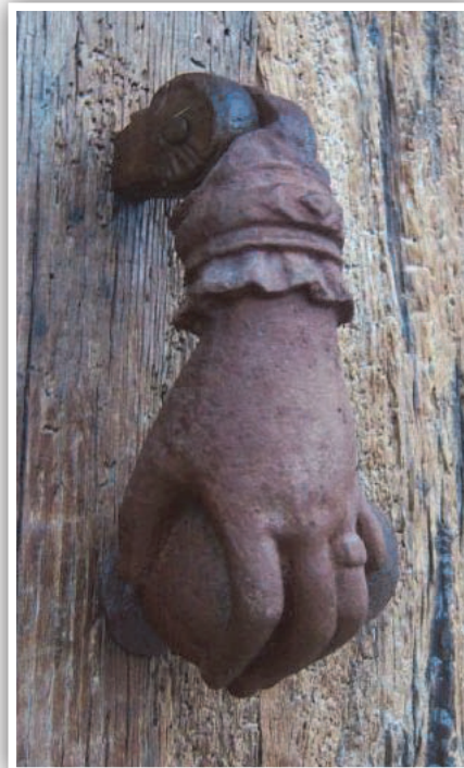
Figura 1. La aldaba.

Es de mencionar, que para el Día Mundial del Sonido, Francesc Daumal i Domènech, Catedrático de la Univer-