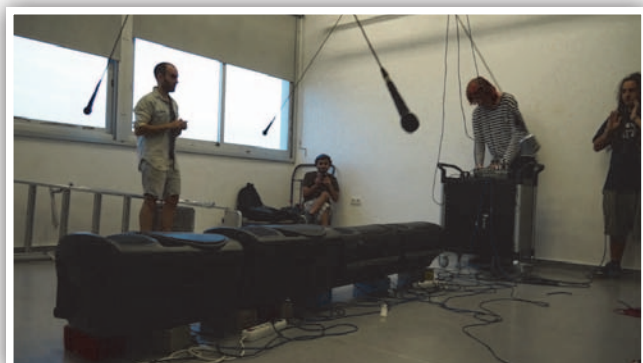
Figura 5. Interpretación de Pendulum Music de Steve Reich (1968-1973).