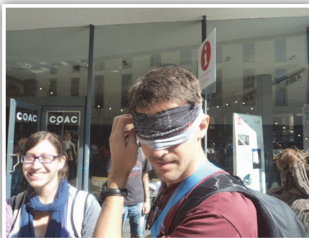
Figura 2. Recorrido por el Barri Gòtic de Barcelona: ciego y guía.