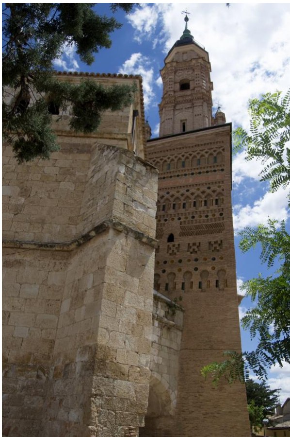
Figura 1. Torre de Santa María de Ateca. Vista general.

En definitiva, el desarrollo de la investigación de estas torres-alminares mudéjares es complejo debido a la falta de documentación exacta sobre su cronología. Por ello, resulta fundamental llevar a cabo un estudio pormenorizado de las torres apoyado en otros medios (la propia lectura de sus fábricas como fuente directa) y/o técnicas avanzadas de levantamiento que aporten un nuevo enfoque. De esta forma, tomando como base los antecedentes y el estado de la cuestión en la actualidad, se aportará una nueva perspectiva al tema objeto de estudio.