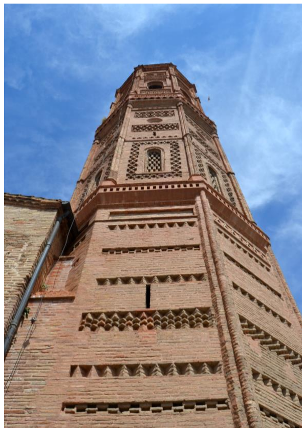
Figura 5. Torre de San Andrés en Calatayud.

En segundo lugar, se recorre la iglesia de San Andrés y su torre en Calatayud, así como el entorno cercano. En este caso, el estado de conservación de la torre presenta variaciones en altura. De esta forma, la accesibilidad se realiza con dificultad en algunos tramos, en especial los dos tercios superiores. Concretamente, el cuerpo de campanas es accesible en su parte baja pero no se accede, por precaución, al remate final de la torre porque se vislumbran posibles problemas estructurales en el forjado de este último nivel.