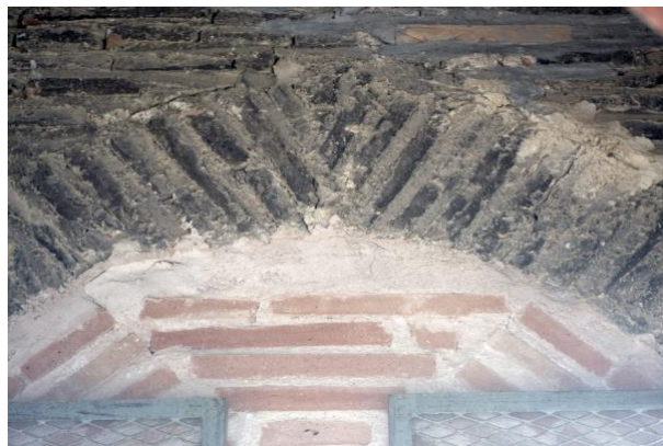
Figura 3. Estratigrafía en campanario de la torre de Belmonte.