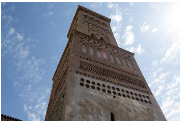
Figura 4. Torre de San Miguel en Belmonte. Fachadas.

Por lo que respecta a las fuentes documentales y orales (párroco de la iglesia), se recopila información referente a la historia y a una de las fases de restauración de la torre.