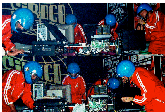
Ilustración 1: sala Siroco, Madrid 2004.

En estos rituales la concepción del espacio sonoro y visual sumergen al espectador en una suerte de lugar para el juego escénico en el que se convierte en protagonista, en paciente, pero no pasivo sino activo. A partir del largo desarrollo de estas partituras escénicas donde el error, la improvisación y la causalidad juegan un papel primordial, es desde donde partimos para crear otros espacios de exposición como este que denominamos sonovisualización .