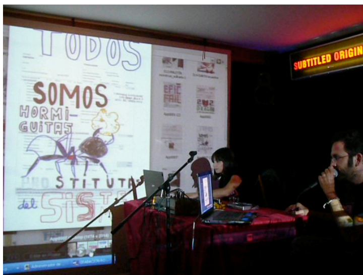
Ilustración 3: sesión Timocracia. Sala La Azotea (Murcia), 2012.

Para nosotros el término sonovisualización hace referencia al proceso de creación de una partitura audiovisual que puede ser guiada por el sonido ejerciendo de protagonista o viceversa, siendo la imagen la que marca/guía/determina el ritmo, el tono, el momento de salto/cambio de una imagen a otra. De este modo la imagen navega a través de las melodías y atmósferas sugeridas por el sonido o al contrario. No se trata tanto de hacer que lo visual esté anclado al ritmo de lo sonoro, sino más bien de hacer que los dos lenguajes participen del dúo y sean guías de la sesión. En términos coreográficos se trataría de que en algunos momentos la imagen lleve a lo sonoro y que en otros sea llevada.