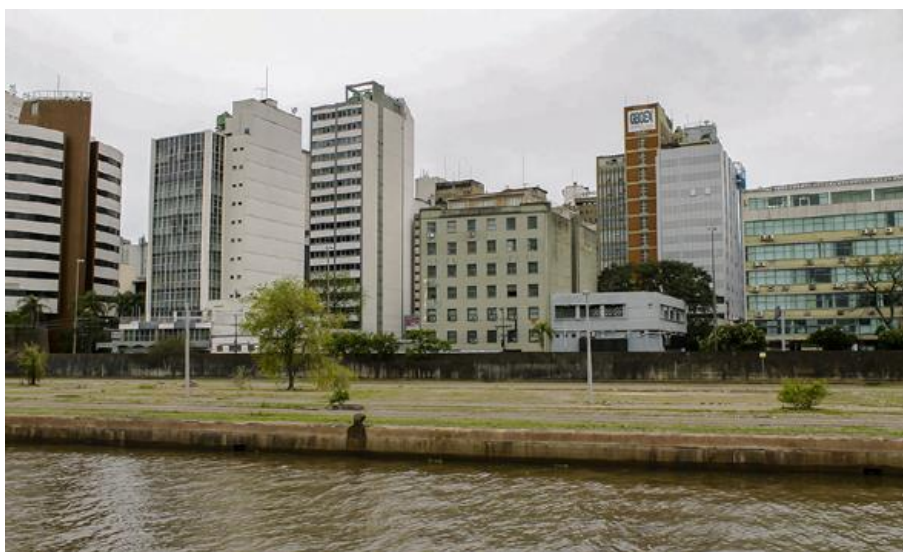
Figura 2- Turista Puede , 2015. Fecha: nov/2015. Lugar: Lago Guaíba – RS /Brasil.

http://dx.doi.org/10.4995/ANIAV.2017.5837