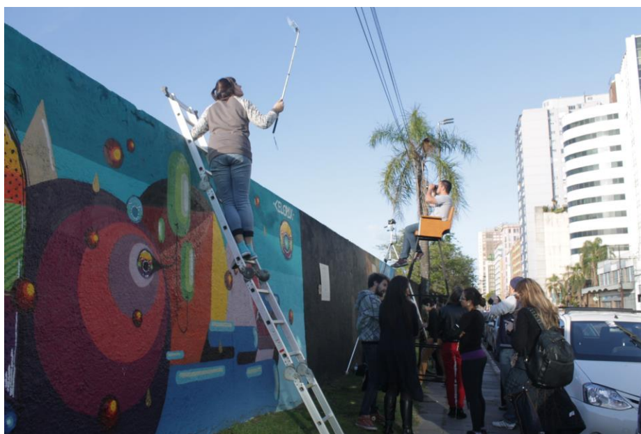
Figura 4- Espição , 2016. Local: Muro da Av. Mauá, em Porto Alegre, RS-Brasil.

Y, desde lo alto, por encima del muro, tal vez, sólo tal vez, este muro-monumento pueda ser entendido no como un objeto estático y permanente, sino como un objeto en el espacio que permite en algún sentido dejarse transformar permanentemente en tener-lugares (Didi-Hubermann, 2009), aunque su deseo de caída no sea así, tan explícito. Practicar sus bordes de dentro, de fuera y de arriba se hace necesario para aquellos que entienden las ciudades como lugares poéticos.