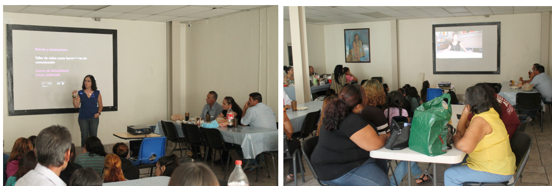
Ilustración 5 y 6. Presentación ante los familiares en el Centro de Rehabilitación Casa Corazón.

En consecuencia, al verse en la grabación tomo momentos de relajación y reflexión sobre su estancia para evidenciar que existen otras maneras de expresar su situación. Y al ver a las mujeres de Porto Alegre (Brasil), saber que no están solas y pueden unirse con otras mujeres.