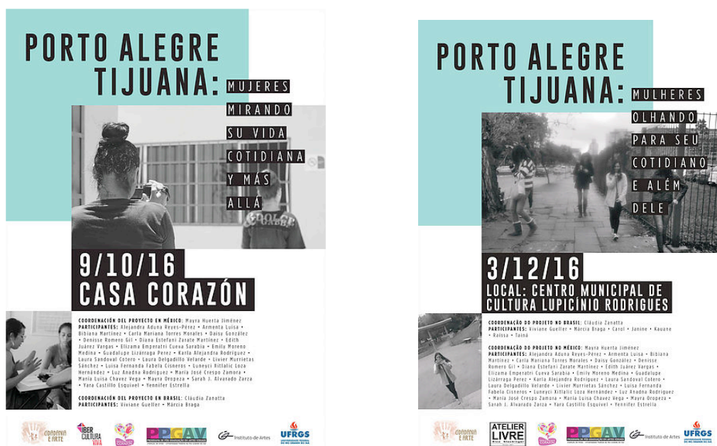
Ilustración 7. Los carteles de difusión de las muestras de video en ambos contextos (Tijuana-Porto Alegre)

El audiovisual ha dado la oportunidad para la emergencia de narrativas como forma de evidenciar la historia y la vida de mujeres que ha menudo no tienen sus actividades cotidianas valoradas. A lo largo de los talleres hemos notado que hubo un compartir de experiencias y que el recurso audiovisual ha potenciado la mirada sobre la propia vida diaria de la ciudad, sea en un ambiente cerrado como es una casa de rehabilitación sea en la libertad de la calle.