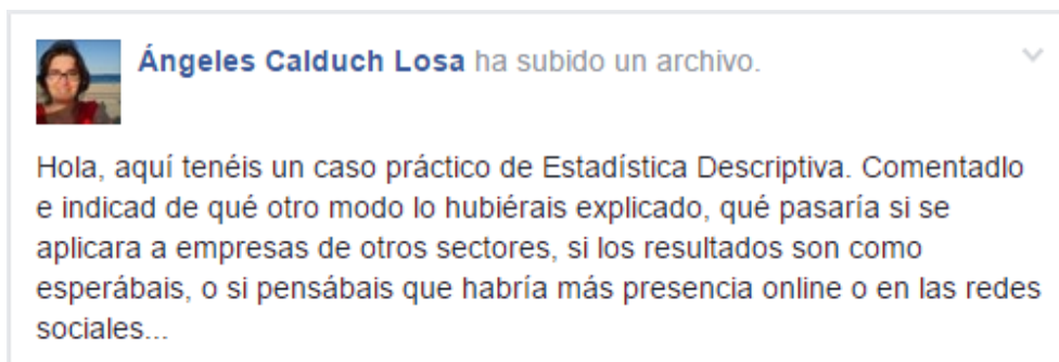
Fig.1 Ejemplo de pregunta a los alumnos

El primer trabajo compartido fue una ponencia presentada por algunos de los profesores en un congreso, en la que se hacía un estudio descriptivo de unos datos, y se les hacía preguntas a los alumnos, como puede verse en la Figura 1. Las preguntas se formulaban de una manera dirigida, para que los alumnos supieran las acciones que tenían que realizar.