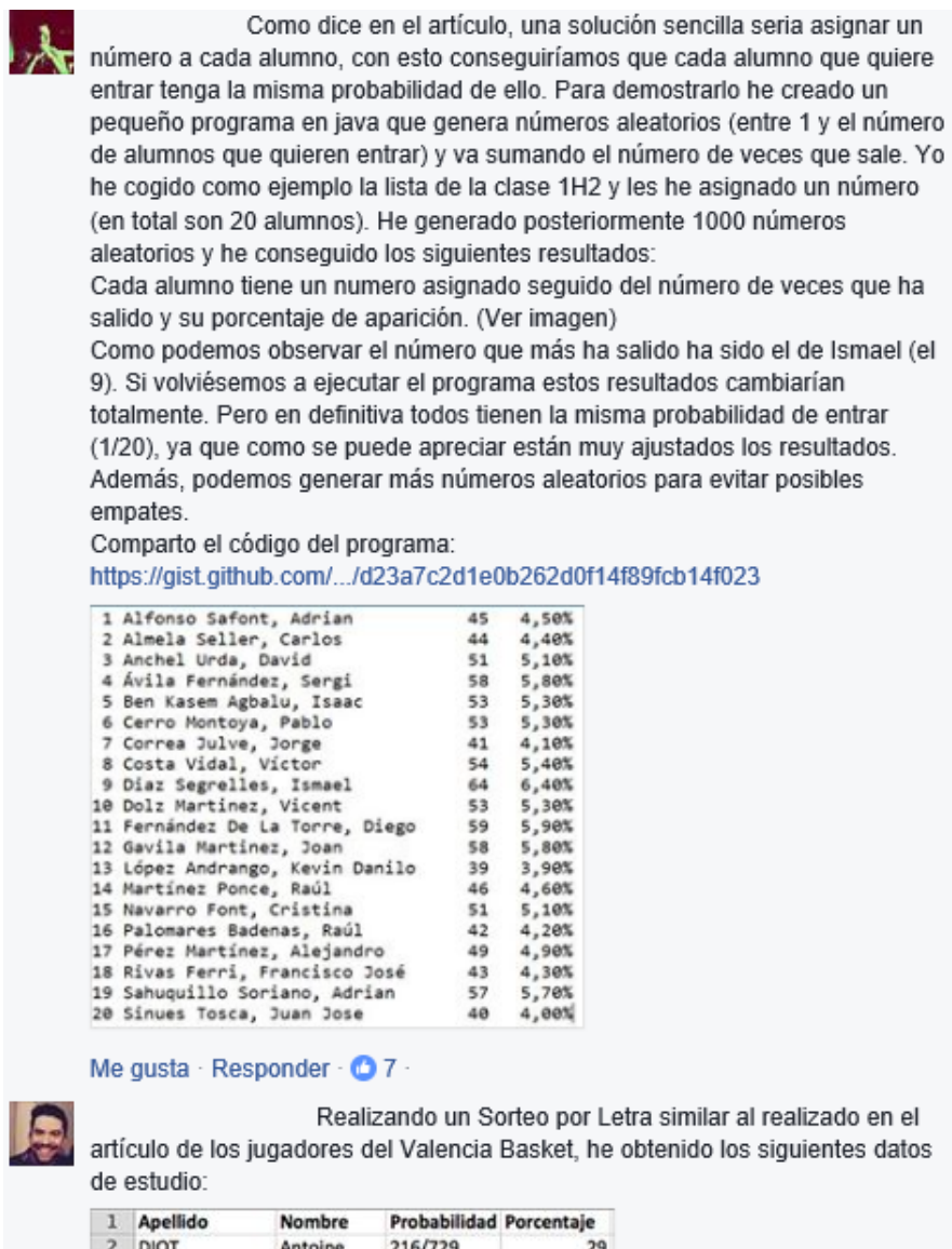
Fig.5 Ejemplo de réplicas por parte de los alumnos