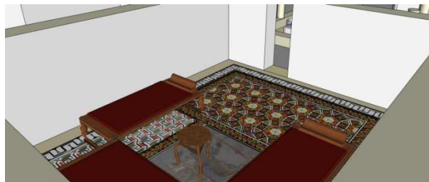
Figura 7: Reconstrucción de un triclinio.

situaban los comensales (MOLS, 2007-2008: 145-160). Como modelo del mosaico se forma de U+T se han tomado los mosaicos de la Villa del Mitra (MORENO ALCAIDE, 2011: 177-187).