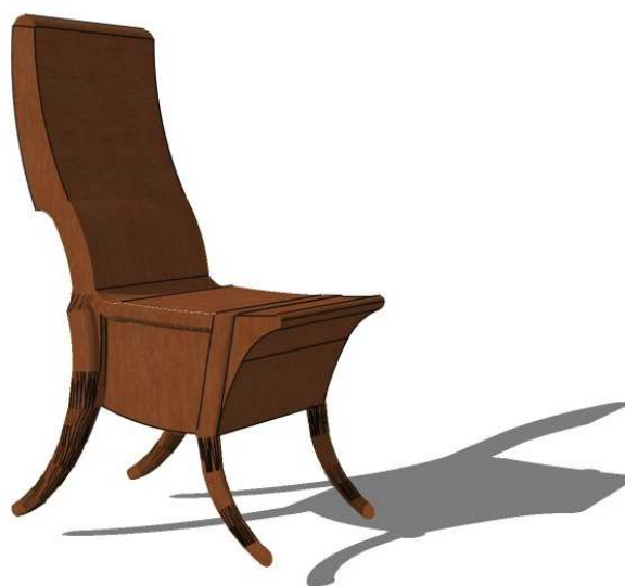
Figura 2: Silla con respaldo curvo.

En relación a las sillas, de nuevo, la cantidad de modelos es muy diversa atendiendo al tipo de respaldo, recto, curvo o sin respaldo; tipo de patas, rectas o curvas; o en relación al tipo de asiento. Nuestro ejemplo tiene el respaldo curvado, el asiento rectangular y las patas curvadas con forma cónica que disminuyen hacia los extremos. Este tipo de silla ya tendría modelos anteriores en el mundo griego, algo que no es de extrañar ya que el mobiliario griego será en parte fuente de inspiración y origen para los muebles que luego serán reproducidos en las casas romanas (ANDRIANOU, 2009).