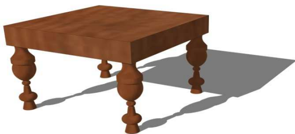
Figura 3: Escabel.

Otra pieza del mobiliario romano, que no por ser pequeña, pasa desapercibida es el escabel. Este pequeño mueble se utilizaba para reposar los pies por lo que acompañaba generalmente a las sillas y a los lechos.