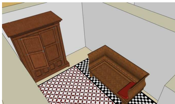
Figura 8: Reconstrucción de un cubículo.

El segundo de los espacios recreados es un cubículo. El mosaico del suelo dividía los espacios de la estancia, en el más pequeño, en este caso en la parte del mosaico ajedrezado se encontraba el lecho, hemos incluido también un armario en el interior de esta estancia aunque probablemente este también se podría encontrar en el tablinum donde el señor de la casa tenía su despacho y se guardaban los archivos de la familia y el dinero dentro de una caja fuerte.