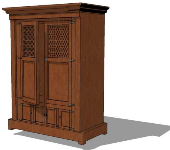
Figura 6: Armario.

aparecen unas pequeñas cajoneras, mientras el resto está ocupado por dos puertas sujetas al cuerpo del armario por bisagras, finalmente está rematado por una pequeña cornisa.