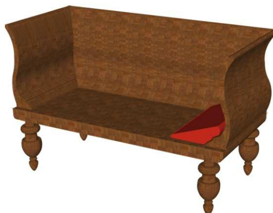
Figura 5: Lecho con respaldo alto.

El último ejemplo realizado es un armario, se apoya sobre cuatro pequeñas patas; la parte central se divide en dos, en la parte inferior