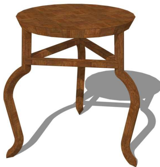
Figura 1: Mesa circular apoyada sobre tres patas.

Respecto a las mesas, los modelos y formas que representan son muy variados, en esta ocasión hemos representado uno de los modelos más extendidos, la mesa circular que se apoya sobre tres patas. Siguiendo los modelos observados en las fuentes hemos hecho las patas con forma de cuarto de círculo acabas en el extremo con una forma triangular representado las patas de un león, para que tuviese una mayor estabilidad, cada una de ellas se une con un listón de madera. Este modelo concreto se utilizaría en las estancias de banquetes ya que por su forma es tamaño era adecuada para este tipo de función, por lo que aparecería vinculada con los lechos triclinares.