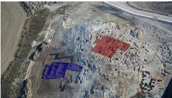
Figura 2. Foto aérea del yacimiento. En rojo la iglesia y en azul las viviendas

Tal y como hemos apuntado, la ocupación en el pago conocido popularmente como La Poza se inaugura con la construcción de un pequeño templo de época hispano-visigoda cuya cronología ronda aproximadamente los siglos VI y VII d. C. Levantado en la cima de un pequeño cotarro que se eleva por encima de un bodón estacional, no debió de funcionar como parroquia hasta el siglo XI, momento en el cual se conforma buena parte del yacimiento arqueológico tal y como ha llegado hasta nosotros en la actualidad (MARTÍN, SAN GREGORIO, 2011: 80-89).