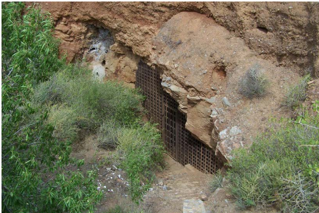
Fig. 2 Vista de una de las entradas al yacimiento (Victoria I)