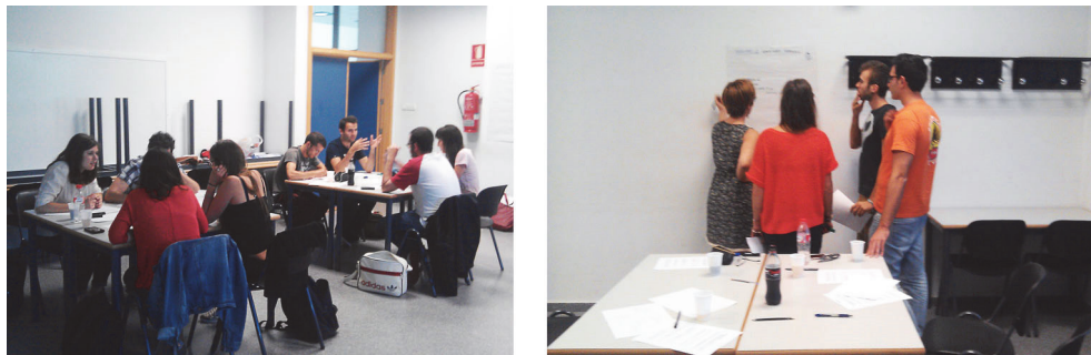
Fig.3 Imágenes de los talleres realizados

OPERA-PAISAJE-ESPACIO-NOSOTROS-YO ¿Cómo relacionaríamos estos conceptos?