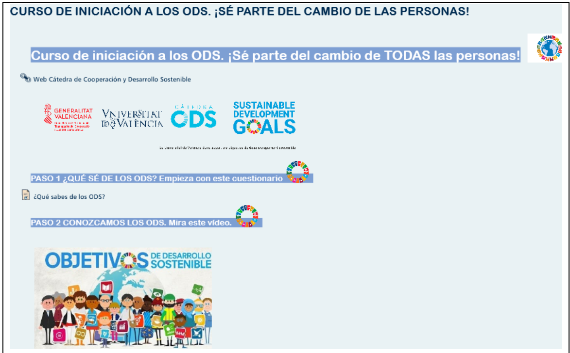
Figura 4. Curso de iniciación a los ODS. ¡Sé parte del cambio de todas las personas!. Cátedra de Cooperación y Desarrollo Sostenible. Universitat de València.

Se desarrolló la actividad diseñada por la Cátedra de Cooperación y Desarrollo Sostenible de la UV, “Curso de iniciación a los ODS. ¡Sé parte del cambio de todas las personas!”. Se realizaron seis actividades que incluían videos y cuestionarios a través del aula virtual con el objetivo de fomentar el conocimiento de los ODS (Figura 4).