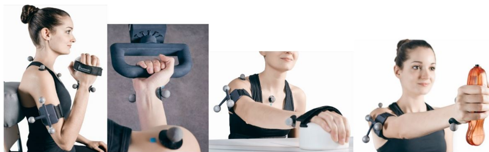
Figura 1: de izquierda a derecha, prueba de flexoextensión, pronosupinación, alcance y fuerza de empuñamiento en flexión y extensión de codo.

Cabe destacar que la preparación del paciente para esta prueba puede ser realizada en menos de 2 minutos, y que tanto este proceso como la ejecución y el registro de los gestos anteriormente descritos resultan especialmente sencillos. En este sentido, el modelo de marcadores seleccionado ha permitido mejorar la agilidad del proceso de valoración.