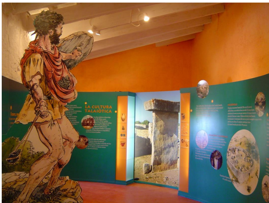
Figura 3. Exposición "Un Món per descobrir", inaugurada en 1997 coincidiendo con la apertura del "Ecomuseo de Cap de Cavalleria".

La creación de espacios culturales, su diseño y apertura al público por parte de iniciativas privadas promovidas por asociaciones, entes personales o empresas, no eran habituales a finales de los años 90 (López-Menchero 2014:397). Incluso en la actualidad, generan cierto recelo y son objeto de discusión ya que se considera que interfieren en competencias y responsabilidades públicas. En cualquier caso, esta situación va cambiando, con la mayor transferencia de gestión, de espacios de titularidad pública y privada, a asociaciones y compañías, ante la necesidad de compartir el gran esfuerzo y coste económico que suponen la responsabilidad del mantenimiento y la preservación del patrimonio cultural.