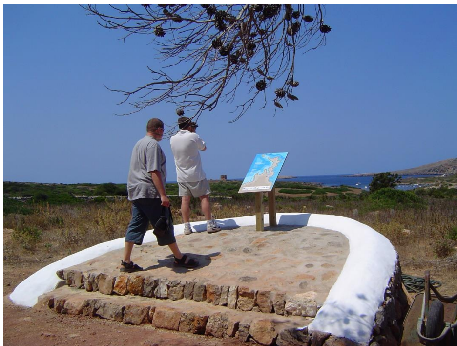
Figura 4. Vista general desde el mirador, punto inicial para emprender las rutas propuestas para visitar el patrimonio arqueológico de Sanitja.

A la hora de la verdad, el "ecomuseo" fue un instrumento clave para poder mantener a nuestra asociación cultural viva, y sirvió para ir investigando, lentamente y sin pausa, el patrimonio arqueológico, y establecer un órgano de gestión en el puerto de Sanitja manteniéndose con su propia financiación sin estar supeditada a criterios políticos improvisados o de corta mirada de diferentes mandatos, y a subvenciones esporádicas o intermitentes. Debemos mencionar que el "ecomuseo" era visitado por más de 10.000 personas al año durante el tiempo que estaba abierto al público, desde el 15 de abril hasta el 30 de octubre diariamente. La afluencia de visitantes regular y el modelo de gestión que se implantó en el territorio del puerto de Sanitja se convirtió en un modelo de referencia para la gestión cultural de Menorca durante una década.