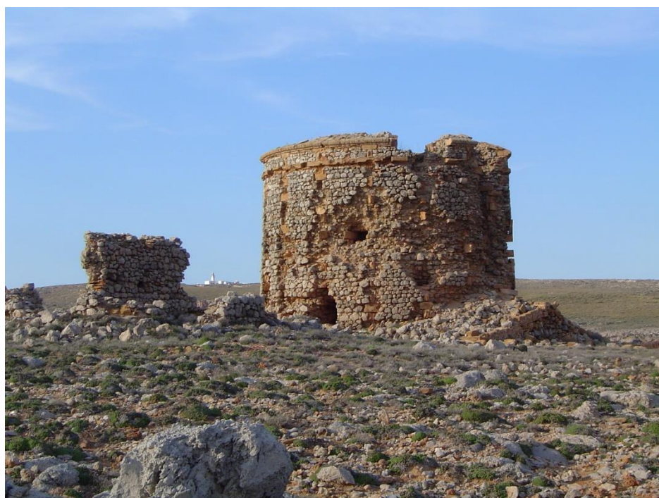
Figura 9. Torre "Martello" de defensa británica previa a su restauración que ha finalizado en abril de 2021.

La rehabilitación de la torre de defensa de Sanitja y las consecuencias que conllevará su restauración. Por un lado, aplaudimos la iniciativa. Los planes directores para la recuperación del patrimonio construido: aproximación metodológica y desarrollo en las murallas de Labraza y nos alegramos de saber que la torre Martello será restaurada, y que uno de los elementos visuales más característicos que integran el puerto de Sanitja , sea recuperado.