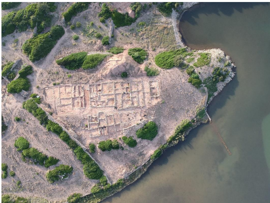
Figura 8. Vista parcial de las excavaciones efectuadas desde 2008 hasta la actualidad descubriendo varios edificios de un complejo eclesiástico de la Antigüedad Tardía.

Además, en los últimos diez años, en el mismo puerto de Sanitja , se han llevado a cabo excavaciones en " Ses Vilotes " que han descubierto parcialmente un complejo eclesiástico de la Antigüedad Tardía, sin igual en las Baleares, con varios edificios de culto y de dos basílicas, que siguen los patrones de arquitectura basilical de los territorios orientales y norteafricanos de la costa mediterránea. Completan el conjunto arqueológico, un total de siete necrópolis dispersadas por el territorio circundante al puerto de Sanitja , de las que se han excavado alrededor de doscientas tumbas en cista, fechadas entre los siglos VI – VII d.C.