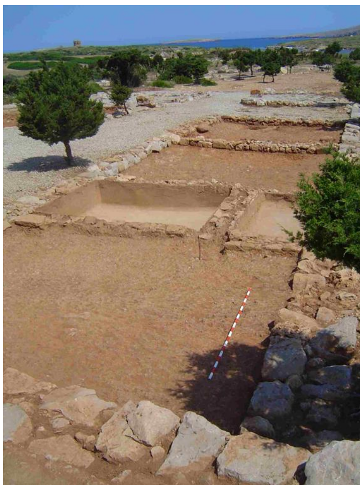
Figura 7. Vista parcial de un barracón que forma parte de un campamento militar republicano del siglo I a.C.

Tras un periodo corto de excavaciones, empleando la fórmula del campo de trabajo enfocado a estudiantes universitarios del ámbito español durante los años 1996-1998, Sanisera decidió programar cursos internacionales de arqueológica para estudiantes universitarios que acogieron la oferta que actualmente todavía continúa vigente. Gracias a ello, se han descubierto vestigios destacados, que son referencias para la arqueología de Menorca, tales como un campamento militar del periodo de conquista romana de las Islas Baleares, y que, hasta el momento, es el único visitable en las Islas Baleares.