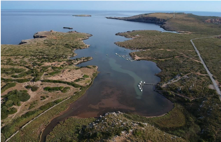
Figura 1. Vista panorámica general del puerto de Sanja (Menorca).

de Santa Teresa, con la exposición permanente "Un Món per Descobrir" (García Blanco 1984).