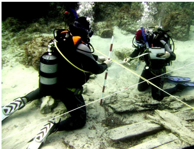
Figura 6. Documentando los restos de un pecio en Sanitja.