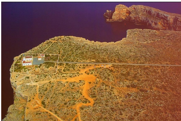
Figura 5. Vista aérea espectacular del Cap de Cavalleria coronada por el faro de Cavalleria, muy frecuentado por turistas.

Nuestra asociación entendía que era muy previsible que el fenómeno turístico perjudicase la existencia del "ecomused" en la casa de campo de Santa Teresa , e intentó que la actividad cultural y sede del centro de interpretación de visitas, se trasladase al faro de Cap de Cavalleria . Se contactó en varias ocasiones con la administración pública que gestiona los faros, Autoridad Portuaria de Baleares, sin tener respuesta alguna, y que lamentable derivó en la desaparición de una iniciativa precursora de gestión patrimonial en la arqueología de Menorca.