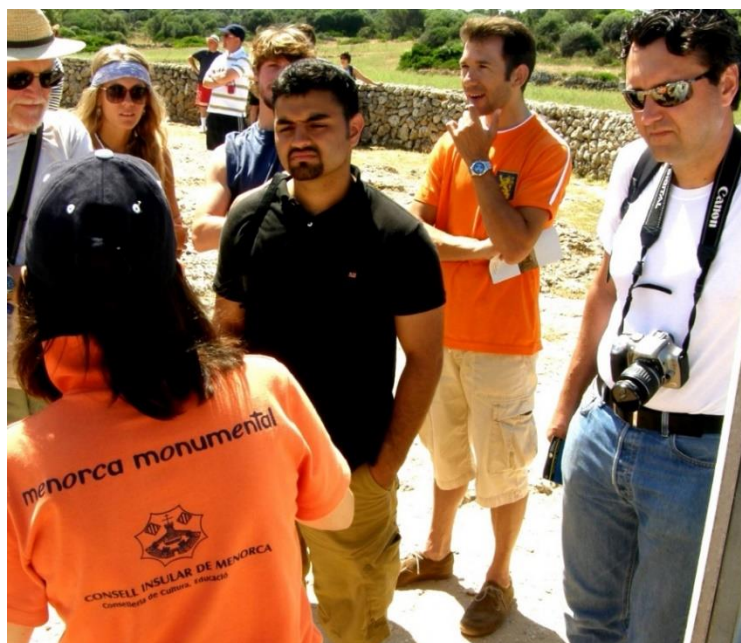
Figura 10. Torre "martello" de defensa británica previa a su restauración que ha finalizado en abril de 2021.

Planes directores en territorio público de Menorca. Los organismos públicos han promovido en los últimos años, la redacción de planes directores para algunos de los sitios más emblemáticos de la isla. Es el caso de los planes directores de " La Fortaleza de la Mola ", " Castell de Santa Agueda ", " Illa del Rei " y los poblados talayóticos de " Son Catlar " y " Torre d'en Gaumés ". El plan director, si se redacta de forma responsable, viable y realista, es la mejor herramienta para poder planificar a corto, medio y largo plazo la investigación y gestión de un sitio y, por tanto, garantizar su conservación (Hugony 2007: 212).