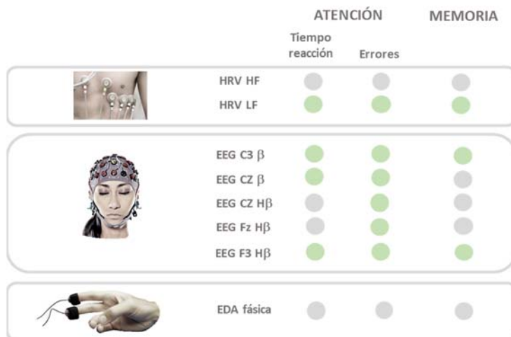
Fig. 2. Combinación de métricas neurofisiológicas integrantes de los índices cognitivos de atención y memoria

Las siguientes métricas neurofisiológicas permitirían registrar datos sin posibilidad de manipulación por parte del sujeto y en tiempo real.