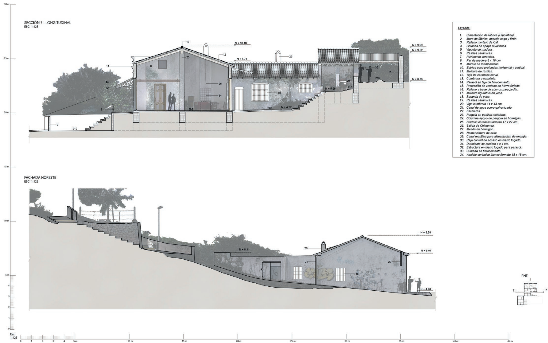
Fig 8. Section 7 and northeast façade. (Source: the authors).