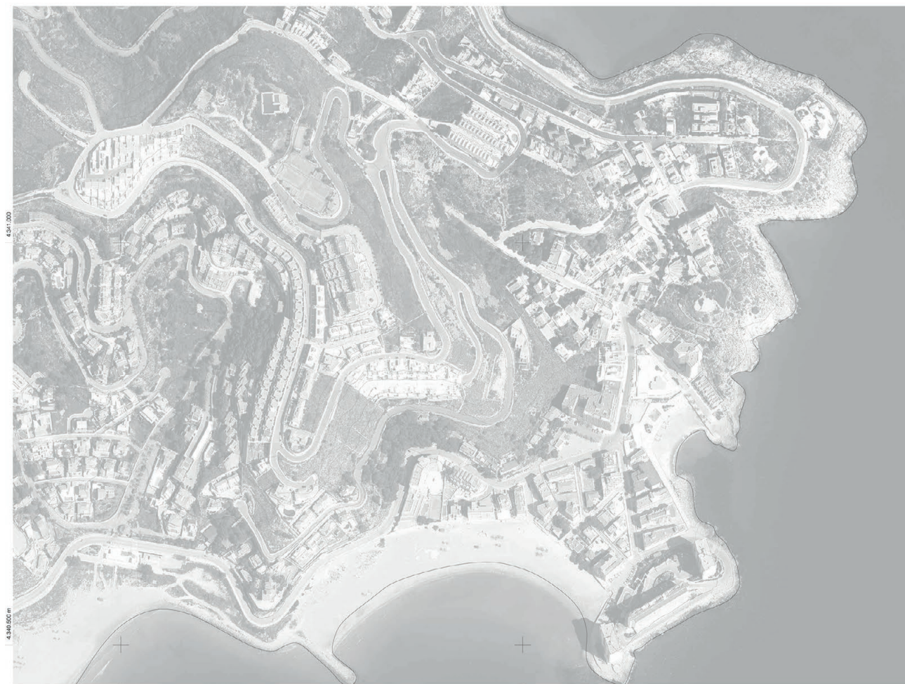
Cabo de Cullera (Valencia)