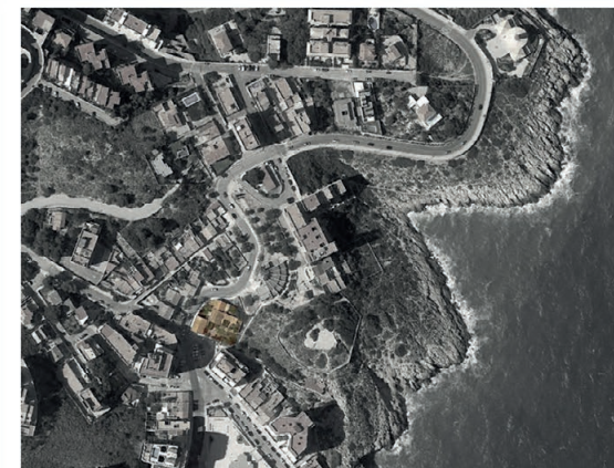
Emplazamiento de las casas de pescadores en el Cabo de Cullera