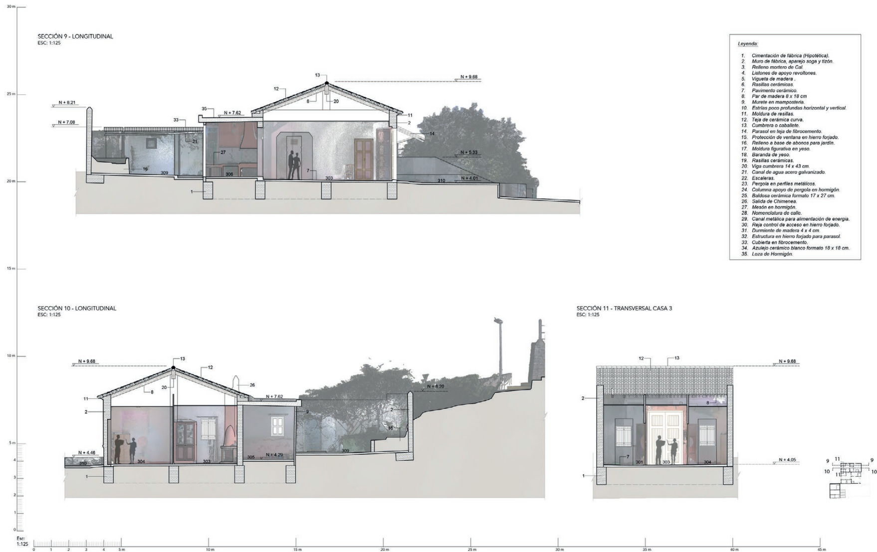
Fig 9. Sections 9, 10 y 11. (Source: the authors).