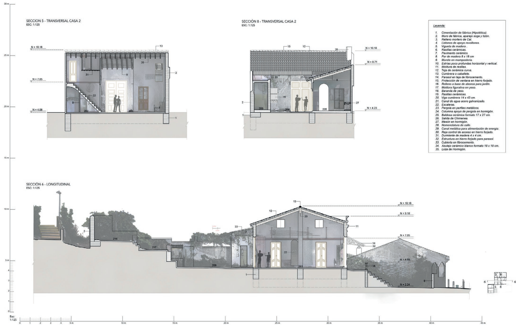
Fig 7. Sections 5, 6 y 8.