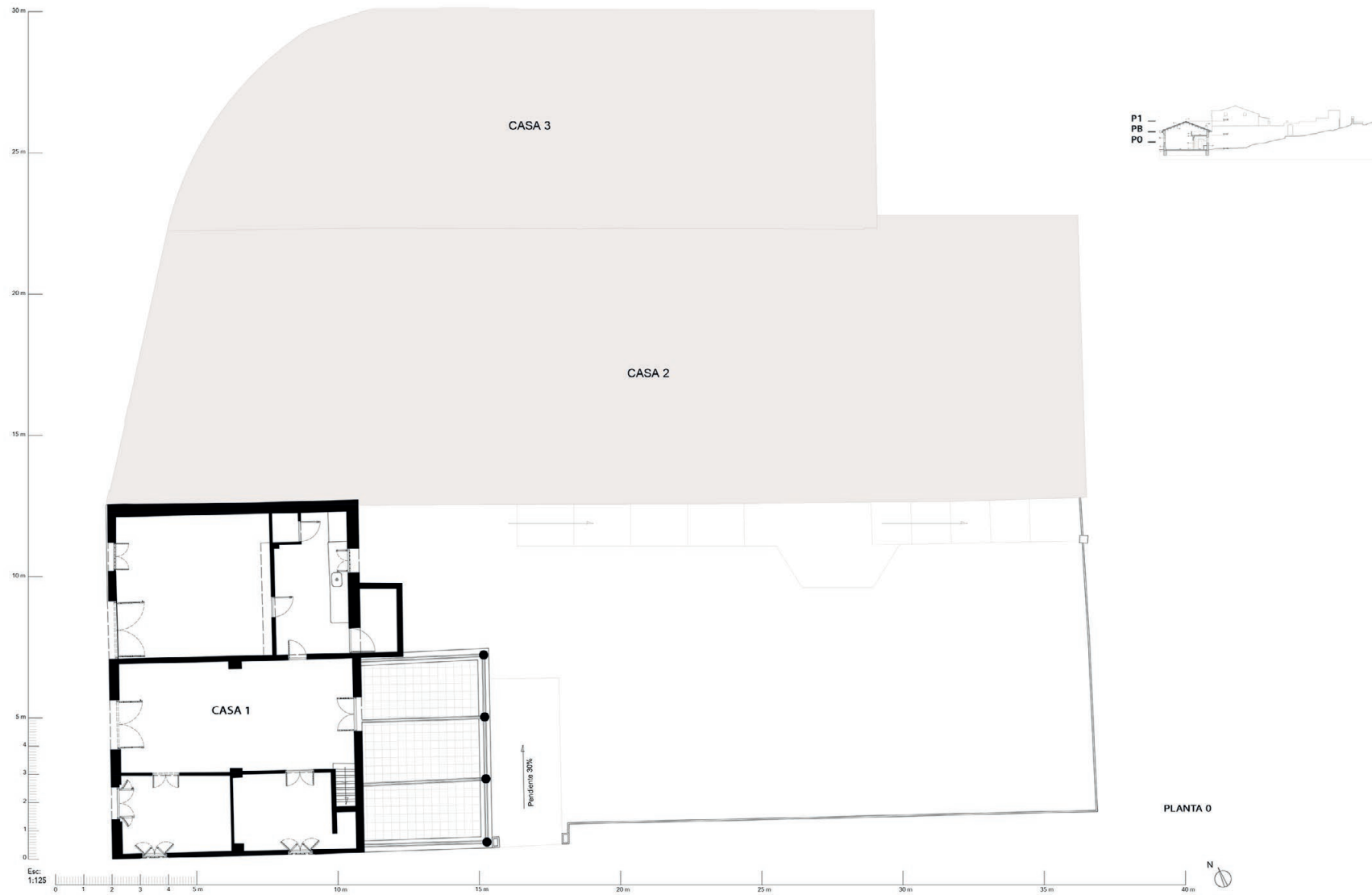
Fig 2. Ground floor.