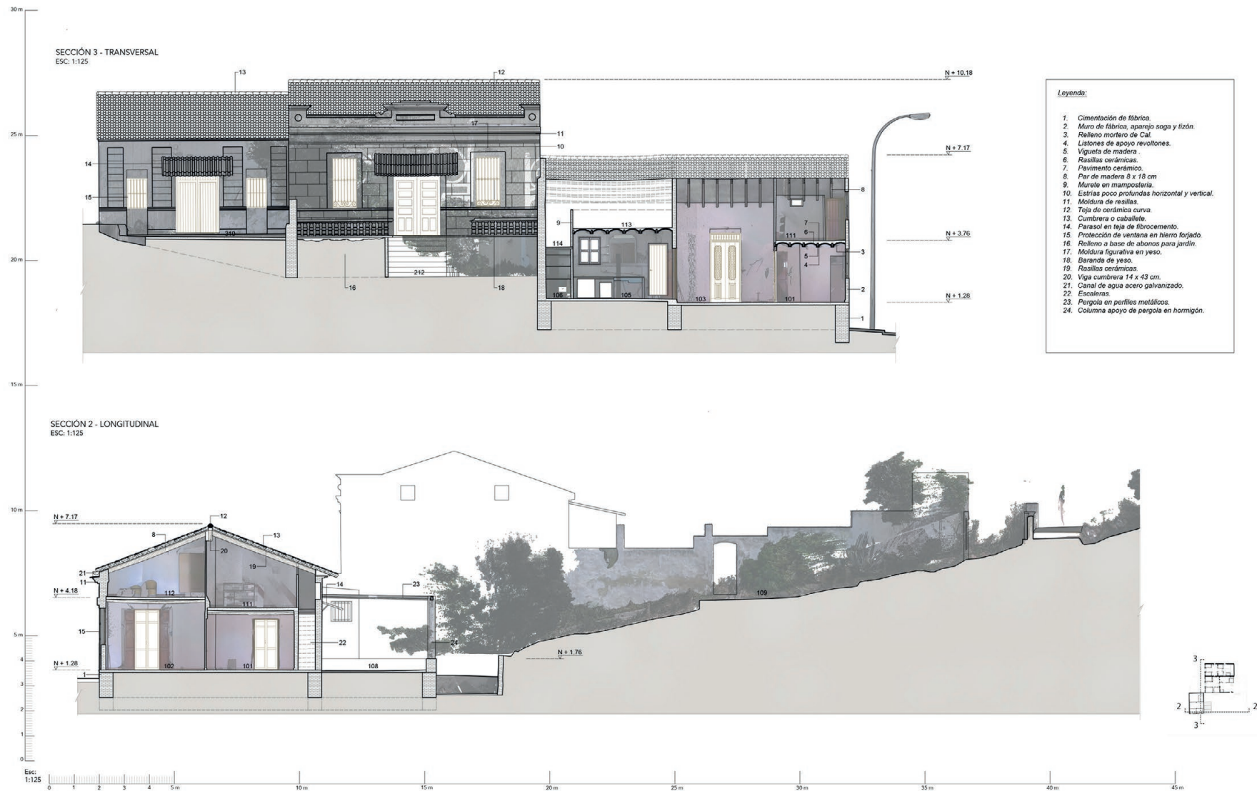
Fig 6. Sections 2 y 3.