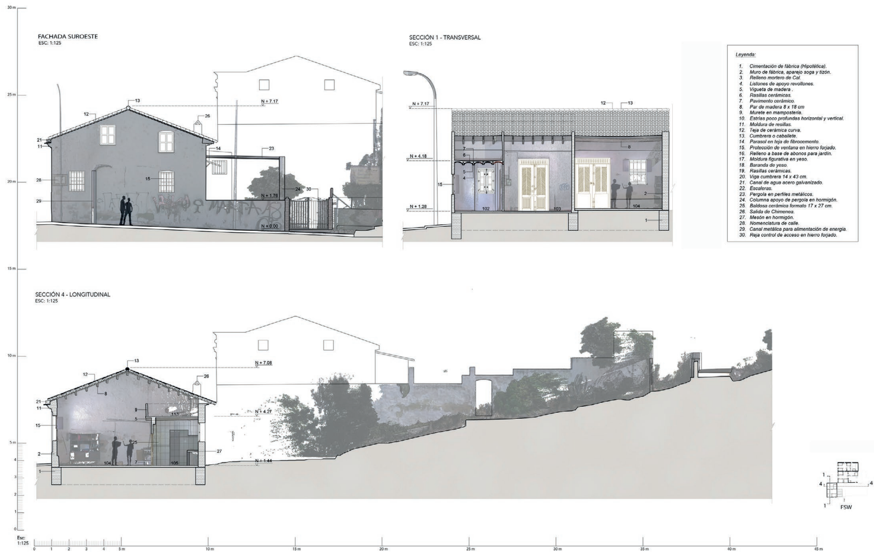
Fig 5. Southwest facade and sections 1 y 4. (Source: the authors).