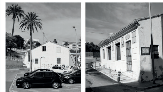
Vistas exteriores de las casas de los Pescadores.