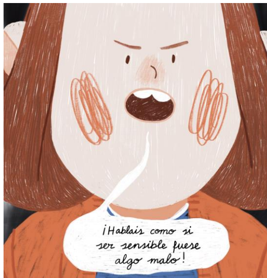
Figura 2. Imágen de álbum ilustrado. Elaboración propia.

Por todas las consecuencias que puede tener el desconocer el rasgo, muchos investigadores y asociaciones están realizando una gran labor de difusión. En este sentido, aunque en todos los estudios mencionados recalcan que es importante sobre todo su conocimiento en la infancia, hemos observado carencias en la transmisión de la información del rasgo a los niños y niñas.