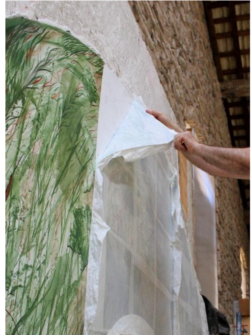
Figura 9. Proceso de separación y desprendimiento de la pintura del muro.