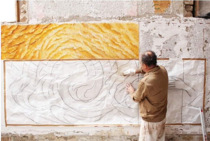
Figura 4. Proceso de transferencia del dibujo al muro; estarcido del cartón sobre el muro fresco.

Otra de sus obras fruto del arranque es la denominada La Odisea (2019) 3 , conjunto configurado por tres murales pintados al fresco en su taller y arrancados mediante strappo . La obra fue encargada por la Universidad japonesa de Waseda (Tokyo, Japón), con el propósito de ubicarla en el laboratorio Simo-Serra del departamento de ingeniería y ciencia informática de dicha universidad japonesa. ( L'artista targarí Josep Minguell arrenca a través de l'strappo un fresc que exportarà al Japó, s. f. )