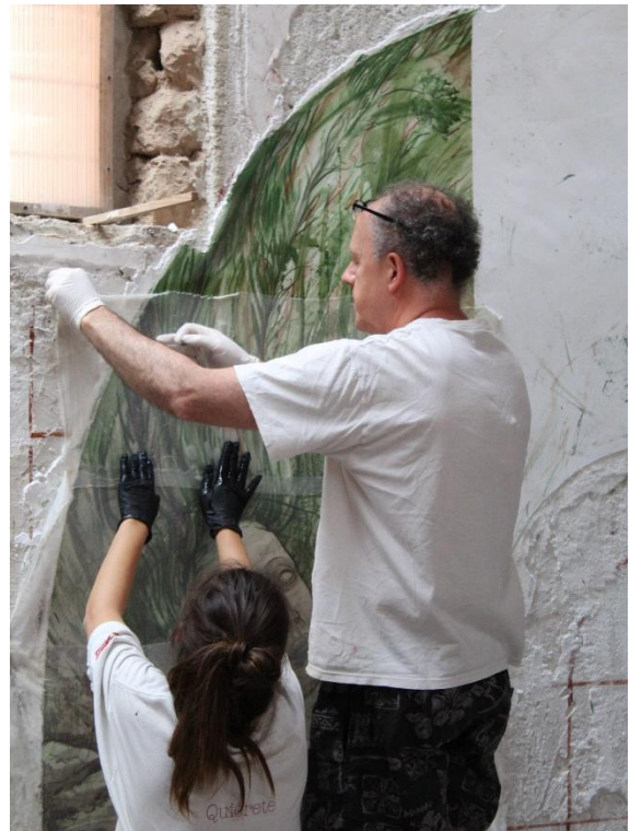
Figura 7. Proceso de encolado para el arranque.