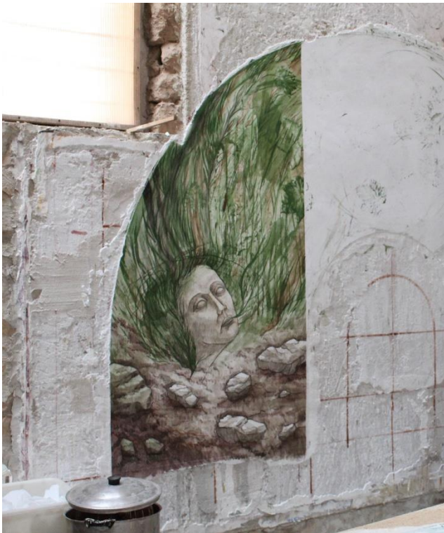
Figura 6. Fotografía de un fragmento de fresco preparado para ser arrancado.

Para llevar a cabo el encolado de la superficie pictórica es necesario emplear telas de algodón y una cola animal. Los restauradores suelen aplicar dos estratos de tela (gasa de algodón y retorta) adheridos con cola fuerte de carpintero. El artista ha adaptado este método en su experimentación artística incorporando dos variantes. En primer lugar, utiliza un único estrato de tela fina de batista de algodón con el que consigue el arranque sin inconvenientes y con los resultados artísticos deseados. En segundo lugar, el material que emplea para adherir las telas es la cola de conejo granulada. En 2021 comenzó a añadir a la mezcla de adhesivo una pequeña proporción de glicerina, un agente humectante que le permite mejor la fluidez del adhesivo y facilitar la aplicación de las telas evitando burbujas de aire entre el textil y la pintura. En cuanto al método de aplicación, para favorecer la adhesión de las telas sobre la superficie pictórica éstas son impregnadas en el adhesivo. ( Josep Minguell i Cardenyès, 2021 )