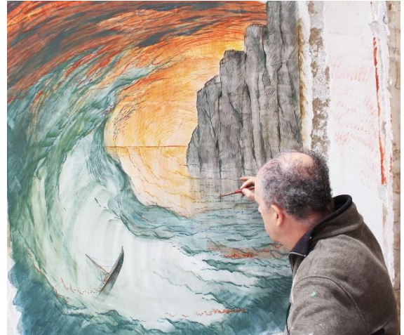
Figura 5. Fotografía del artista pintando al fresco sobre el muro.