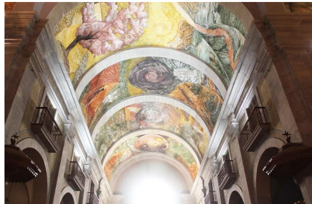
Figura 2. Conjunto del ciclo pictórico de la bóveda de la Iglesia de Santa María del Alba, en Tárrega. Minguell i Cardenyas, 2011.

Hace una década el artista introdujo en su producción artística una nueva técnica, el arranque. En 2012 conoció el proceso del strappo a través del arranque de uno de sus frescos. El trabajo de extracción del mural fue realizado por los conservadores del Centre de Restauració de Béns Mobles de Catalunya , a cargo del restaurador Pere Rovira. (Minguell i Cardenyas, 2022, p. 1)