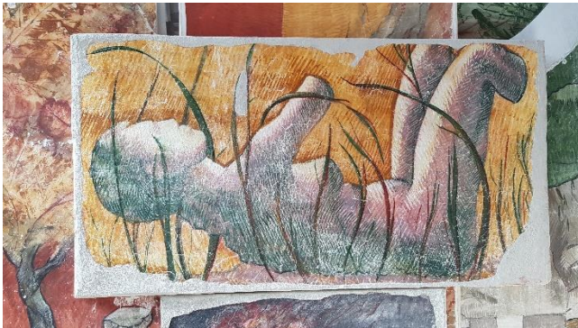
Figura 10. Obra de Josep Minguell realizada mediante strappo .

Por último, se debe especificar que el artista no coloca ningún marco a este tipo de obras; la ausencia de marco es un recurso vinculado a la idea del fragmento que intenta transmitir a través de sus arranques. ( J. Minguell i Cardenyès, comunicación personal, 25 de octubre de 2021 )