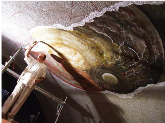
Figura 1. Bóveda de la Iglesia de Santa María del Alba, en Tárrega. "Creació de l'Univers".

La trayectoria artística de este pintor se caracteriza por su amplia producción de murales pintados con la técnica al fresco. Minguell ha trabajado en numerosos proyectos creando ciclos pictóricos en diferentes espacios arquitectónicos, recuperando la tradición histórica del fresco e insertándola en el contexto artístico contemporáneo. Las ideas que albergan en sus obras se fundamentan en las relaciones y los vínculos que existen entre la pintura mural, el espectador y el espacio arquitectónico. Entre sus proyectos destaca el ciclo de pinturas murales al fresco que ornamenta varios espacios del interior de la Iglesia de Santa María del Alba, en Tárrega (Figura 1 y 2). (Climent et al., 2015, pp. 33-42)