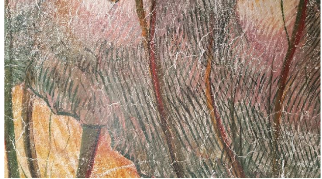
Figura 11. Detalle de una obra de Josep Minguell realizada mediante strappo .