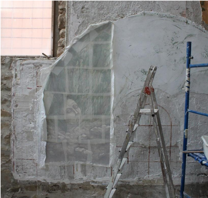
Figura 8. Finalización del proceso de encolado.

Una vez finalizado el encolado de toda la superficie pictórica y cuando la cola ha secado por completo, se produce la contracción del material adhesivo lo que permite la separación de la capa pictórica del resto de estratos, quedando adherida a las telas y desprendiéndose definitivamente del muro (Figura 9).