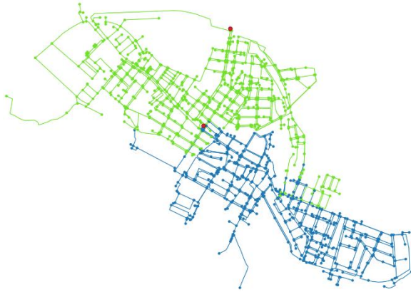
Figura 1. Red de Paterna con 2 sectores

máxima o el porcentaje de nodos que no cumplen con un valor de presión mínima.