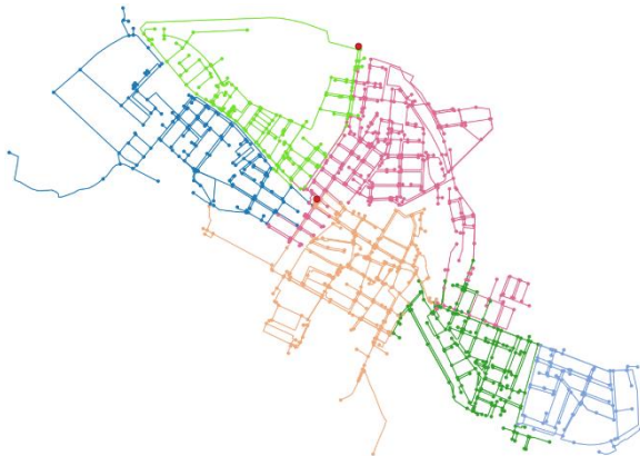
Figura 2. Red de Paterna con 6 sectores