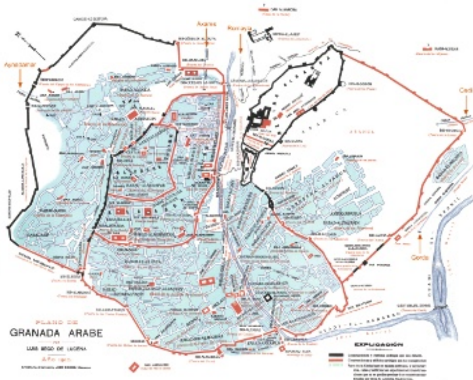
1. Map by Luis Seco de Lucena (1910) showing the shape of the irrigation ditches in the Moorish Granada.