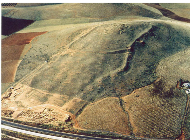
Fig. 3 El Cerro de las Cabezas a finales de los años 90 del pasado siglo. En la parte inferior de la imagen, se observa el avance de las excavaciones.

Entre los años 1990-1995 se produce una paralización de las excavaciones, lo que permite acometer tareas de mantenimiento y organización de materiales arqueológicos, algo también fundamental en este yacimiento.