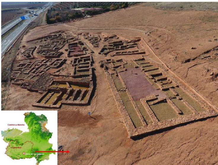
Fig. 1 Localización del Cerro de las Cabezas en Castilla -La Mancha y vistas de la zona urbana del oppidum (2020)

Localizado al suroeste de la ciudad de Valdepeñas (Ciudad Real), el Cerro de las Cabezas es un yacimiento arqueológico de los denominados oppida , dado que es una ciudad amurallada situada en la ladera este del cerro homónimo, junto al Jabalón. Su cronología nos remite a etapas correspondientes al Bronce Final, en torno al siglo VII a.C., desarrollándose posteriormente hasta conseguir su plenitud entre el siglo V y mediados del III a.C., abandonada a fines del siglo III / principios del siglo II a.C., en el contexto de la II Guerra Púnica, sin presentar apenas ocupaciones posteriores, salvo algún indicio de ocupación medieval musulmana en la parte superior del yacimiento (Torres et al. , 2016: 693; Vélez et al. , 2017).