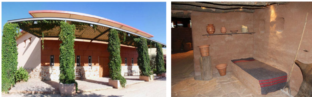
Figs. 4.a y 4.b Exterior del Centro de Interpretación y reproducción del interior de la casa del alfarero (2020)

Desde ese momento hasta la actualidad, más de 150.000 personas han pasado por las instalaciones del Conjunto Arqueológico visitando el Centro de Interpretación, así como por el yacimiento arqueológico, el cual fue acondicionado para su visita a través de un recorrido establecido, una cartelería, etc. En este sentido, hemos de considerar que el turismo arqueológico resulta fundamental tanto económica como socialmente para estas zonas (López-Menchero, 2012: 108-110).