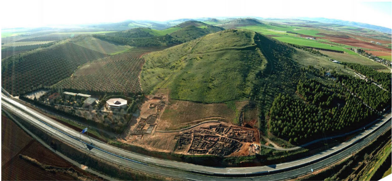
Fig. 6 Vista panorámica del Cerro de las Cabezas y las instalaciones anexas, en la parte izquierda de la imagen.

arqueológico del Cerro de las Cabezas, en Valdepeñas, publicado el 19 de diciembre de 2021. A partir de estos momentos y en un plazo de no más de un año el proyecto de Parque Arqueológico del Cerro de las Cabezas debe comenzar a andar.