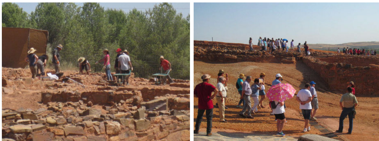
Figs. 5.a y 5.b Curso de Arqueología ORISOS/UNED 2017 y Jornadas de Puertas Abiertas en el Cerro de las Cabezas.

La investigación del yacimiento no ha cesado en estos años, basándose en parte en las Ayudas a la Investigación Arqueológica de la Junta de Comunidades de Castilla La Mancha, en colaboración con el Ayuntamiento, institución esta última que continúa aportando Planes de Empleo 3 que permiten proseguir con la restauración y consolidación de las estructuras excavadas, dado que al ser una excavación abierta sufre un continuo deterioro.