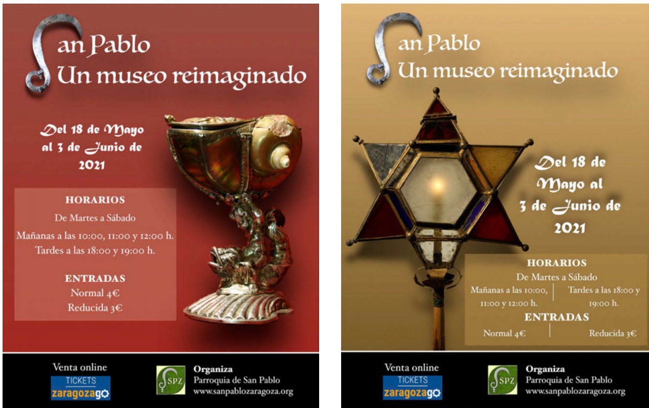
Fig. 1 Dos carteles anunciadores de San Pablo, un museo reimaginado

La idea central de San Pablo. Un Museo Reimaginado parte del concepto Emergente o PopUp. Desde los años 2007 y 2008 y, especialmente, durante la crisis económica mundial, han surgido diferentes propuestas comerciales y expositivas en las principales ciudades del mundo donde se aboga por el carácter temporal de los establecimientos y espacios artísticos. La intención es, principalmente, ser un centro de atracción temporal, ampliando la visibilidad, en el aspecto comercial de los productos a vender y en el artístico y expositivo de los artistas emergentes y novedosos.