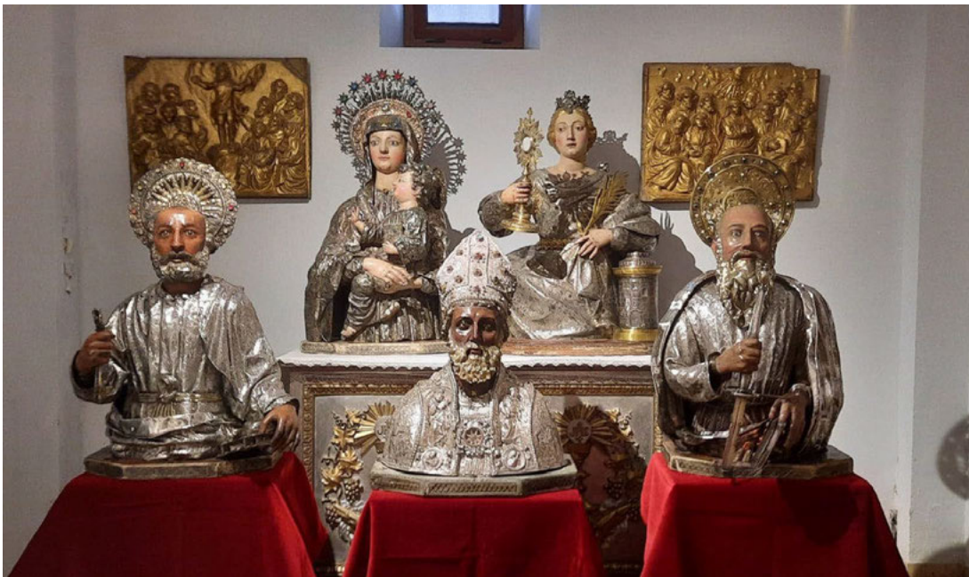
Fig. 5 Bustos de plata expuestos en la Sala de las Maravillas

Entre las obras expuestas destacaba la colección de 5 bustos de plata de la iglesia 3 , mostrados al público en conjunto por primera vez desde hacía décadas. La pieza más importante es el busto de San Blas, realizado por el platero zaragozano Andrés Marcuello en 1561. También destacaban los bustos, ya de periodo barroco, de San Pablo y San Pedro, de Nuestra Señora del Pópulo del siglo XVII y de Santa Bárbara del siglo XVIII. Entre las pinturas se puede destacar, entre otras, el óleo sobre tabla del Llanto por el Cristo muerto, del siglo XVI, que algunos especialistas vinculan con artistas del renacimiento francés, y la pintura de Nuestra Señora del Pópulo, realizada por José Luzán en el siglo XVIII con los característicos colores dorados del barroco-rococó. También se puede reseñar por su curiosidad el Arca de Caudales realizada con toda probabilidad en el siglo XVI.