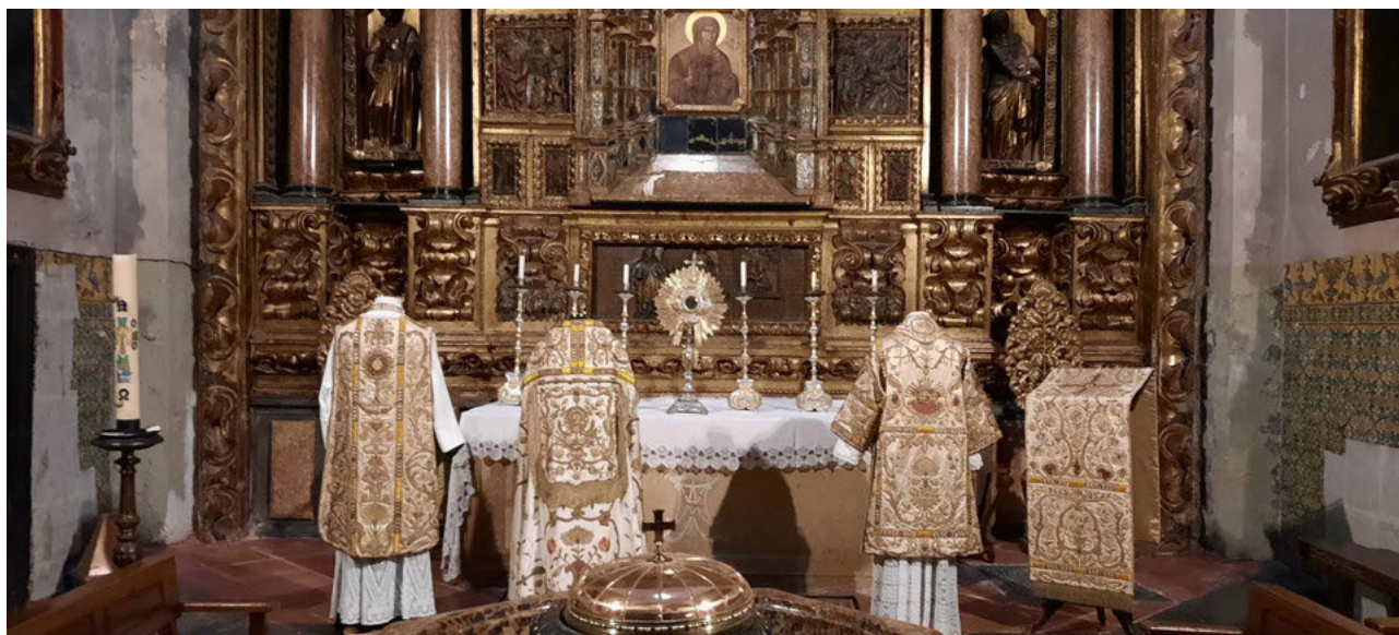
Fig. 4 Vista general del Espacio 3 con la exposición de ornamentos litúrgicos

A continuación, en la capilla de Nuestra Señora del Pópulo (Fig. 4) nos encontramos el Espacio 3 del museo dedicado a los textiles. Entre toda la gran colección de ornamentos litúrgicos de nuestra iglesia, que abarcan diferentes épocas, desde el siglo XVI hasta la actualidad, y todo tipo de colores litúrgicos; seleccionamos el llamado Terno del Corpus, utilizado tradicionalmente en esta fiesta. Su elección vino motivada, por una parte, por la estrecha vinculación de esta capilla con el culto al Santísimo Sacramento y, por otra, por celebrarse la Fiesta del Corpus en el año 2021 el día 3 de junio, fecha del 90 aniversario de la declaración de San Pablo como Monumento Nacional.