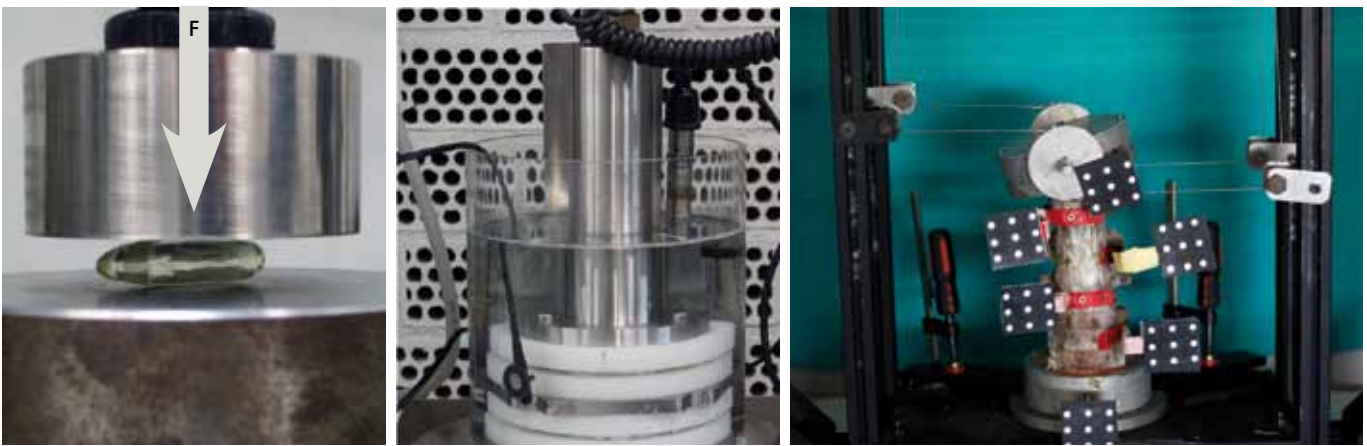
Figura 2. Validación del comportamiento de la prótesis mediante ensayos en laboratorio: ensayos de caracterización mecánica del implante y ensayos in vitro sobre columnas cadavéricas.