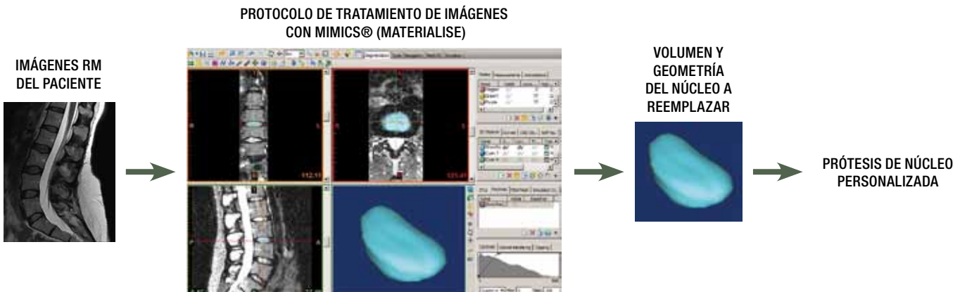
Figura 1. Proceso de personalización de la prótesis de núcleo pulposo a partir de las imágenes médicas (resonancia magnética) del paciente.