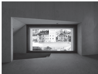
FIG. 01 FIG. 02 FIG. 03 FIG. 05 FIG. 06 FIG. 07 FIG. 08 FIG. 09