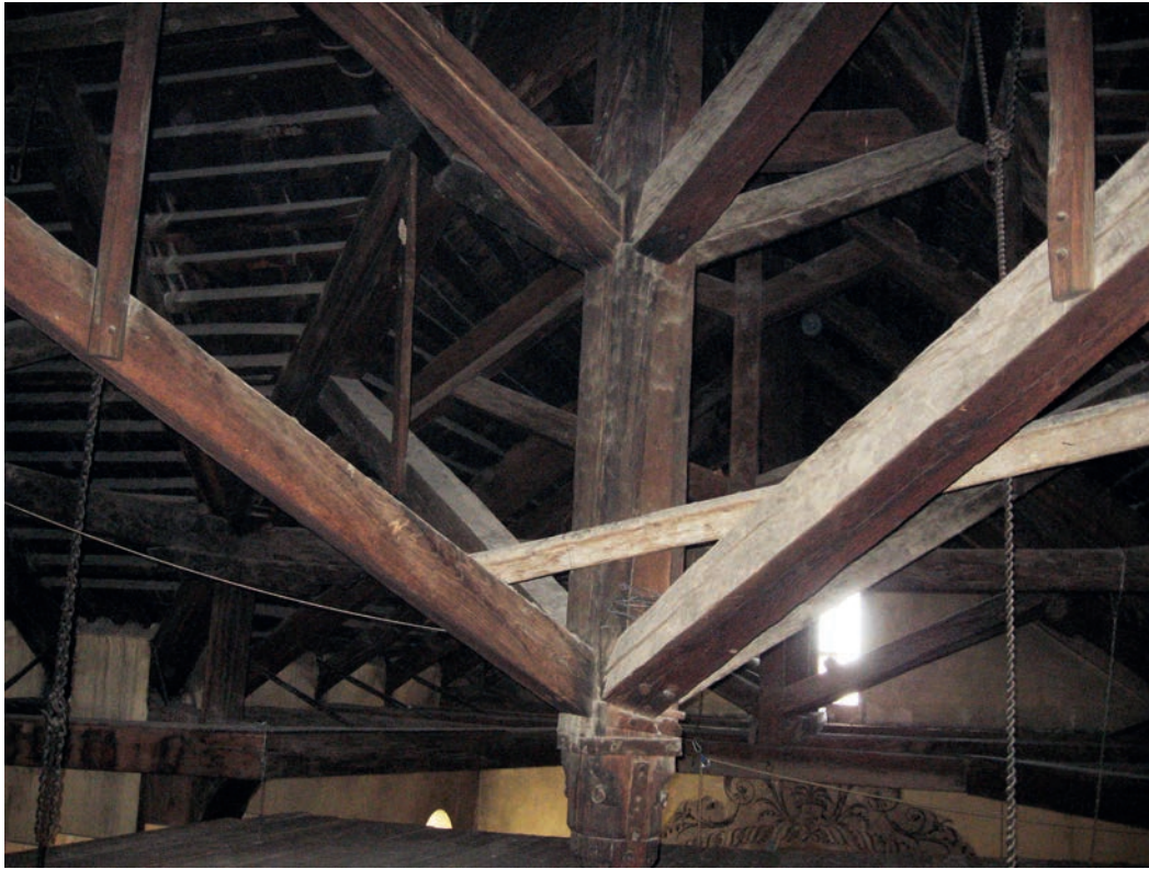
1. Detalle de la estructura de madera de la basílica de la Natividad de Belén

Palabras clave: madera, datación, dendrocronología, especies, estadística, anillos de crecimiento