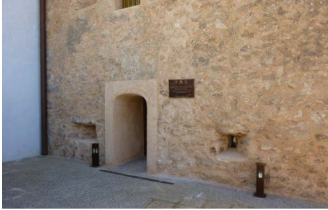
Fig. 11.- Acceso a la Torre de Los Caballos después de la restauración. (P.E. Collado)

Ermita y la fachada de acceso principal de la Torre. En cuanto al pequeño aseo que había en el patio y que era principalmente para uso de la Ermita, la instalación debía mantenerse pero integrándola en la nueva solución de esta explanada de acceso a la Torre y sin que se destacase.