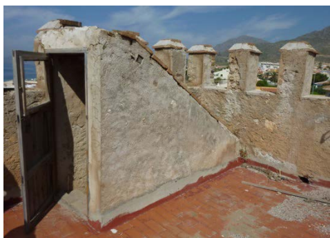
Fig. 5.- Detalle del estado de conservación del acceso a la cubierta antes de la restauración. (P.E. Collado)

En general, el estado de conservación de la edificación era relativamente bueno, ya que se encontraba en uso. No obstante requería actuaciones de mejora, fundamentalmente en cuanto a la limpieza general de los paramentos, restitución de las pequeñas lagunas de material pétreo en fachadas, tratamiento de las numerosas humedades por capilaridad en muros y filtraciones de cubierta, adaptación de las instalaciones de iluminación y electricidad, reparación del acceso a la cubierta, sustitución de los pavimentos interiores y de la terraza, restauración de las almenas, restauración de las carpinterías... Pero fundamentalmente la actuación debía centrarse en devolver el estado interior original a la Torre, sin las particiones del uso esporádico que se le estaba dando como apartamento, y acondicionar la edificación para albergar el nuevo espacio museístico dedicado a dar a conocer las torres vigía y toda la historia que hay alrededor de ellas.