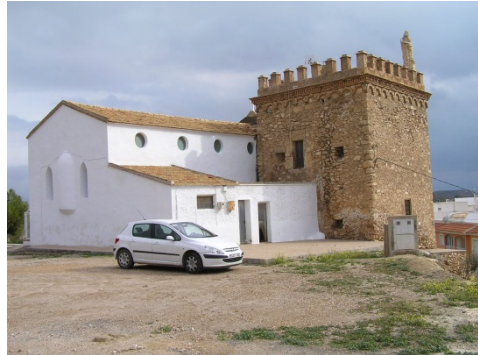
Fig. 2.- Imagen general de la Torre de Los Caballos y la ermita de la Purísima Concepción, antes de la restauración. (P.E. Collado)

Bolnuevo, para vigilar y alertar a la población ante posibles invasiones corsarias desde el mar. Es de planta cuadrada y está construida con muros de carga de mampostería en piedra caliza tomada con argamasa de cal y presenta dos niveles interiores, además de una cubierta con almenas.