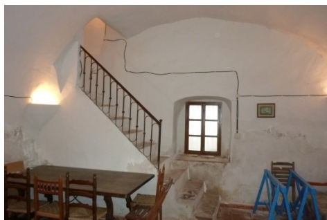
Fig. 6.- Planta baja interior de la Torre antes de la restauración. (P.E. Collado)