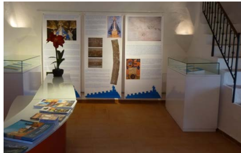
Fig. 10.- Plata baja acondicionada con paneles expositivos. (P.E. Collado)

para convertir la Torre en un nuevo referente cultural de Mazarrón. Actualmente, la musealización se ha visto impulsada con la oferta de visitas teatralizadas en las que los visitantes interactúan con un “pirata” que les enseña la Torre y explica cómo era la defensa de las costas, para terminar con unos juegos en los que los visitantes ponen en práctica todo lo aprendido.