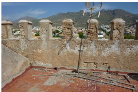
Fig. 7.- Detalle del estado de conservación de las almenas antes de la restauración. (P.E. Collado)

En tercer lugar, se buscaba el acondicionamiento del entorno inmediato de la edificación histórica al objeto de mejorar su imagen y sus condiciones como espacio abierto de acogida de visitantes. Sobre este espacio, que queda delimitado delante del acceso principal de la Torre, se han centrado las actuaciones para la mejora de accesibilidad y las diferentes acciones informativas y didácticas proyectadas, pero además, se ha creado una pequeña zona de estancia y descanso de visitantes, con un mobiliario urbano compuesto por un banco, papelería, cartelería y una pérgola de madera diseñados acorde con el entorno histórico, arquitectónico y cultural que conforman la Torre y la Ermita.