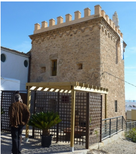
Fig. 1.- Torre de Los Caballos después de la intervención. (P.E. Collado)

objetivos a desarrollar en los años siguientes la planificación de diferentes actuaciones para la mejora, en todos los ámbitos, de la Bahía de Mazarrón con el fin de convertirla en un referente cultural y turístico de la Región de Murcia, prestando especial atención a todos los recursos históricos, sociales, arquitectónicos, naturales, paisajísticos y culturales que posee esta zona y a su potencialidad. En concreto, este Plan Director, en el apartado correspondiente al análisis y propuestas de actuación para mejorar y potenciar los numerosos “Recursos Históricos y Culturales” de la zona, detalla unos criterios y metodología de intervención que se han seguido en la rehabilitación y puesta en valor de la Torre de Los Caballos con el objetivo final de la creación de un nuevo espacio museístico dedicado a las torres vigía del litoral de Mazarrón potenciando así la Torre como recurso no sólo histórico y arquitectónico sino también cultural y turístico. Y todo ello prestando especial atención a la recuperación integral del Bien de Interés Cultural para su correcto mantenimiento y conservación.