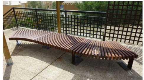
Fig. 13.- Detalle del banco de madera en la zona estancial. (P.E. Collado)

Se ha creado una zona estancial, para el control de accesos, acogida y descanso de los visitantes, frente a la entrada a la Torre. Se trata de un espacio cerrado, para dotar de mayor seguridad a los accesos de la Torre y sacristía de la Ermita, en el que se ha colocado una decorativa reja con cancela. Se ha realizado una iluminación ornamental con balizas de diseño en acero corten y, como nuevo mobiliario urbano, se han colocado un moderno banco de madera sin respaldo y formado una “s” en planta, una papelera en acero corten y una pérgola de madera. Para mejorar la imagen de esta zona estancial se ha colocado una pantalla curva, a modo de biombo, realizada en acero corten y con una altura de 2,50 metros que permite ocultar a la vista las construcciones menores que quedan adosadas al lateral de la Ermita, es decir, el aseo (que ahora está remodelado y sólo es accesible desde la sacristía) y un nuevo almacén, de reducidas dimensiones, que sustituye al viejo trastero que existía y que ahora sirve de cuarto de limpieza de la Torre.