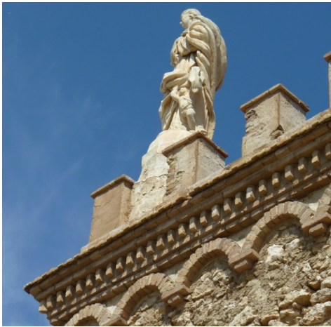
Fig. 3.- Imagen de la Virgen en la terraza de la Torre antes de la restauración.

Recibe el nombre de Torre de Los Caballos porque en origen tenía, entre sus construcciones anexas, unas caballerizas que hoy en día están desaparecidas y que ocuparían el lugar donde ahora se encuentra la Ermita de la Purísima Concepción. Estas caballerizas debían estar al servicio de los vigías y desaparecerían, como muy tarde, en el año 1946 que es cuando se construyó la actual Ermita reformando nuevamente la Torre. De esta intervención destaca la colocación de la figura de la Virgen que corona la terraza de la construcción.