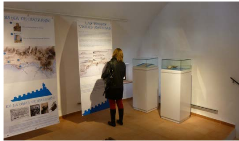
Fig. 14.- Detalle de la musealización de la planta primera.

“pirata” que les enseña la Torre y explica cómo era la defensa de las costas, para terminar con unos juegos en los que los visitantes ponen en práctica lo aprendido. Por tanto, la intervención y puesta en valor de la Torre de Los Caballos ha supuesto la recuperación de una edificación histórica y la creación de un nuevo espacio expositivo que complementa la oferta cultural y de ocio de Mazarrón.