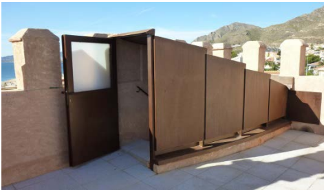
Fig. 9.- Detalle del casetón de acceso a la cubierta. (P.E. Collado)

Además, la cubierta presentaba un pavimento cerámico que no era el original y que se encontraba muy deteriorado por lo que se eliminó. Para evitar filtraciones, se rehicieron los faldones de cubierta y se impermeabilizó, colocándose un nuevo pavimento de baldosa de granito. Las almenas, que presentaban pérdidas de revoco fueron restauradas con mortero pétreo entonado con el resto de las fábricas. Para el acceso directo a la cubierta se eliminó la caseta de fábrica de ladrillo, muy deteriorada, y se colocó un nuevo casetón de acero corten