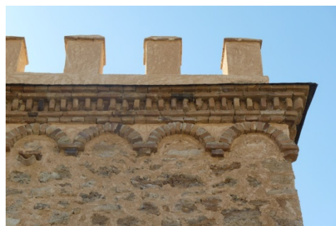
Fig. 8.- Detalle de las almenas y molduras de ladrillo ya restauradas. (P.E. Collado)

En primer lugar se procedió a la limpieza general de la edificación y su entorno inmediato, con extracción del mobiliario que aún quedaba en su interior y la eliminación completa de la tabiquería, en las dos plantas, para dejar los niveles exentos y poder, más adelante, adaptar la Torre como local expositivo. En las fachadas se procedió a la eliminación de las pintadas existentes con el uso de proyección de agua destilada a presión controlada y cepillado manual con cepillo de cerdas suaves. Las pequeñas grietas de los muros de mampostería fueron inyectadas con lechada de cal y cosidas con varillas de fibra de vidrio, consiguiendo la continuidad y estabilidad estructural de la fábrica. En pequeñas zonas que presentaban lagunas y carencias de material, se realizó la reintegración con material pétreo de distinta tonalidad de la existente, aunque sin destacarse en exceso, y mortero de cal coloreado para su entonación con el mortero existente, en una intervención que perseguía la diferenciación sutil entre materiales originales y nuevos pero con un marcado interés de recomposición integradora, además de aplicar un tratamiento hidrofugante como protección final (probado previamente para que no afectase a la textura y tonalidad de los paramentos originales de mampostería y que no produjese brillos). Para el tratamiento de las molduras de ladrillo visto se procedió el mismo criterio.