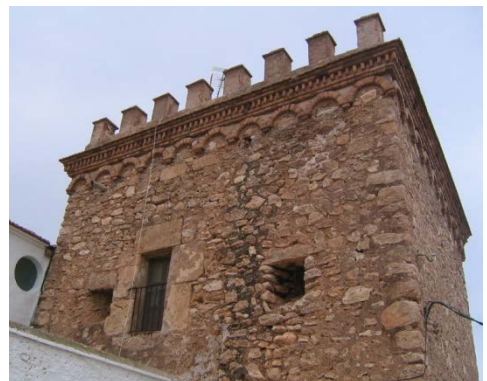
Fig. 4.- Detalle del estado de conservación de la Torre antes de la restauración. El actual balcón debió ser el acceso original. (P.E. Collado)

La Torre se encuentra en un entorno urbanizado, dentro del núcleo urbano de Bolnuevo, y la apertura de calles de los últimos años había abierto un importante desnivel en su lado sur, sujeto por una importante estructura de contención de tierras. Aunque por su elevación en origen contaría con importantes vistas sobre el frente marítimo, las nuevas edificaciones han ocultado la perspectiva.