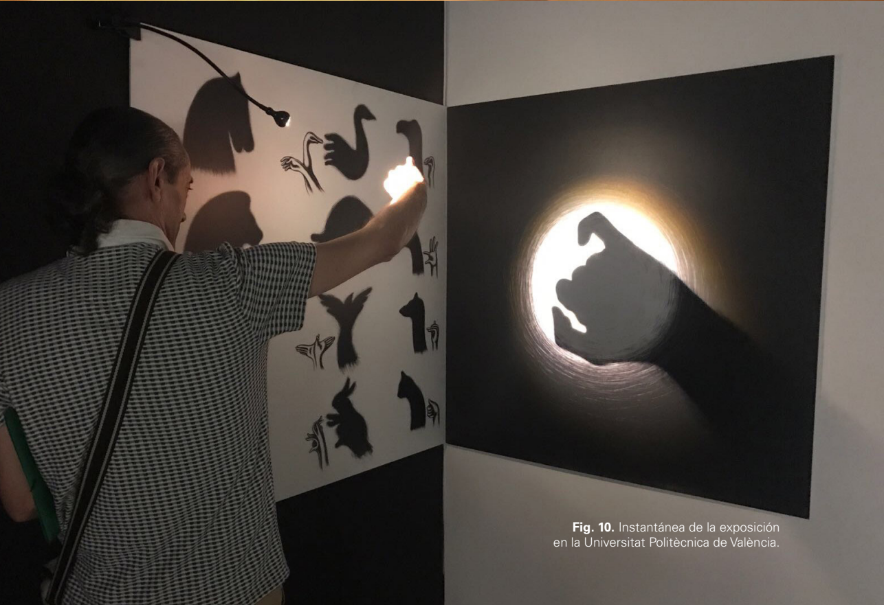
Fig. 10. Instantánea de la exposición en la Universitat Politècnica de València.