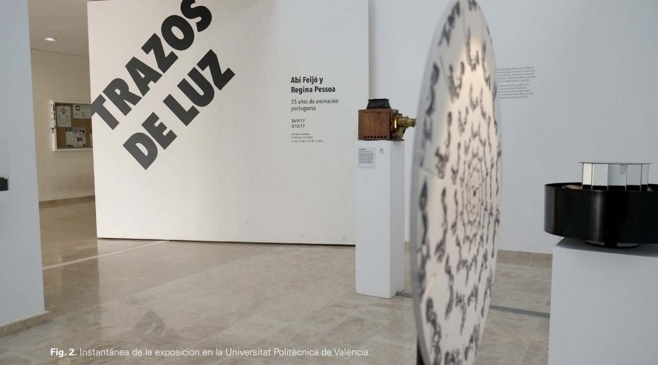
Fig. 2. Instantánea de la exposición en la Universitat Politècnica de València.

Trazos de luz es una exposición retrospectiva de los animadores portugueses Abi Feijó y Regina Pessoa, comisariada por quienes escriben estas palabras. Se inauguró el 26 de septiembre de 2017 y ha podido verse hasta el mes de diciembre en la Sala Josep Renau de la Facultat de Belles Artes de la Universitat Politècnica de València.