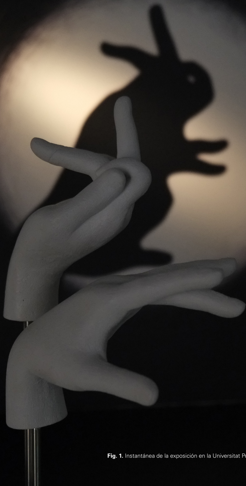
Fig. 1. Instantánea de la exposición en la Universitat Politècnica de València.