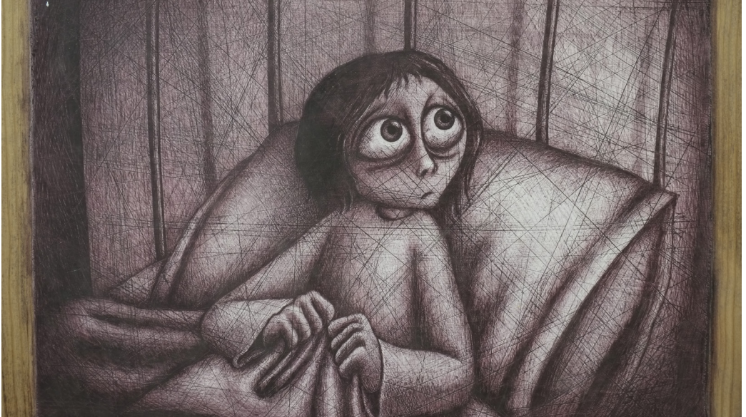
Fig. 8. Dibujo original sobre escayola tintada para la producción de A Noite (Regina Pessoa, 2000).

las formas del fotograma nos transportan, en un proceso casi hipnótico, al terror nocturno sentido por esa pequeña protagonista de ojos grandes. A noite supuso para Regina una inversión titánica en esfuerzo, pero fue rápidamente gratificada en forma de premios: esta película pudo verse en casi todos los festivales y puso a la animadora a la altura de los mejores animadores del mundo. Pero los grandes premios llegarían con Historia trágica com final feliz ( Historia trágica com final feliz , 2006) que se hizo, entre otros, con el Grand Prix de Annecy. El gran contraste de la tinta negra con el brillo del couché, nos desvelaba, a ritmo de sístole —como el corazón de la niña—, el pedaleo, los vecinos, los perros, las ventanas y puertas de esa calle con resistencia al cambio, a aceptar a una personita que no era como los demás. Esta vez la artista atravesaría el papel entintado, de un gramaje especial, en busca del trazo de luz.