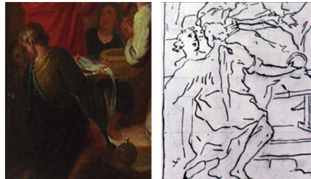
Figura 10. Composición de personajes del modelino basada en uno de los bocetos del artista valenciano.

No obstante, al profundizar en el estudio del lienzo de gran formato, se sabe que la obra se encontraba en mal estado de conservación antes de su restauración y que la zona ocupada por el personaje en cuestión era una de las que presentaba mayores daños, destacando la pérdida de estratos pictóricos 2 . Por ello, se podría deducir que, en un inicio, el individuo sí aparecía en el cuadro de altar pero que, a lo largo de los años la obra sufrió daños que deterioraron dicha zona, imposibilitando la recuperación del personaje en la última restauración y, por lo tanto, centrando la reintegración únicamente en el relleno de la laguna para cerrarla. Además, otro dato que nos hace pensar que el personaje sí estaba incluido en un principio en la composición del lienzo de gran formato, es que entre las fuentes gráficas de José Vergara que utilizaba como referencia, existe un boceto en el que aparece el mismo individuo en la misma posición.