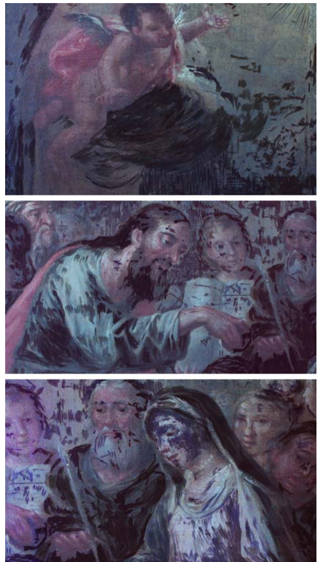
Figura 14. Detalles de la escena del modelino en luz ultravioleta que muestran los retoques de carácter invasivo que se realizaron en la última restauración.