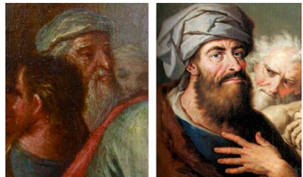
Figura 4. Hombre con turbante, a la izquierda en el modelino y a la derecha en la obra titulada “Bustos”, de la Real Academia de San Fernando en Madrid.