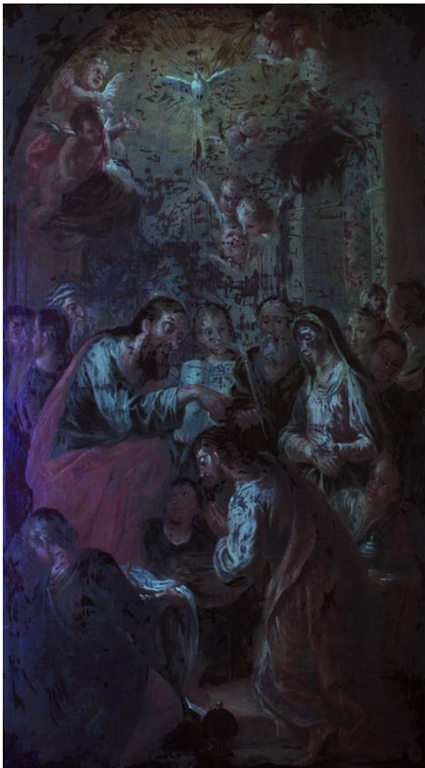
Figura 13. Fotografía general en UV del modelino, realizada en el taller de Restauración de Pintura sobre Caballete del Instituto de Restauración del Patrimonio de Valencia.

Además, el estudio de la producción artística de José Vergara también ha permitido establecer una relación del modelino con el cuadro de altar de la Capilla Bautismal de la Catedral de Mallorca y, así mismo, con el otro boceto pictórico perteneciente a la Academia de Bellas Artes de San Fernando de Madrid. Así pues, gracias a este nexo basado principalmente en que las tres obras representan de forma casi idéntica el mismo bautismo, y al estudio documental realizado de la imagen y los personajes que aparecen en ella, se puede identificar la escena como “El Bautismo del rey Clodoveo”, restituyendo así su iconografía.