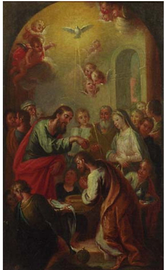
Figura 1. “Escena de Bautismo”. Mercado del arte, Madrid.

Evidentemente, nos encontramos ante una obra que ha sido interpretada incorrectamente a nivel iconográfico, resultando este punto muy importante ya que, gracias al