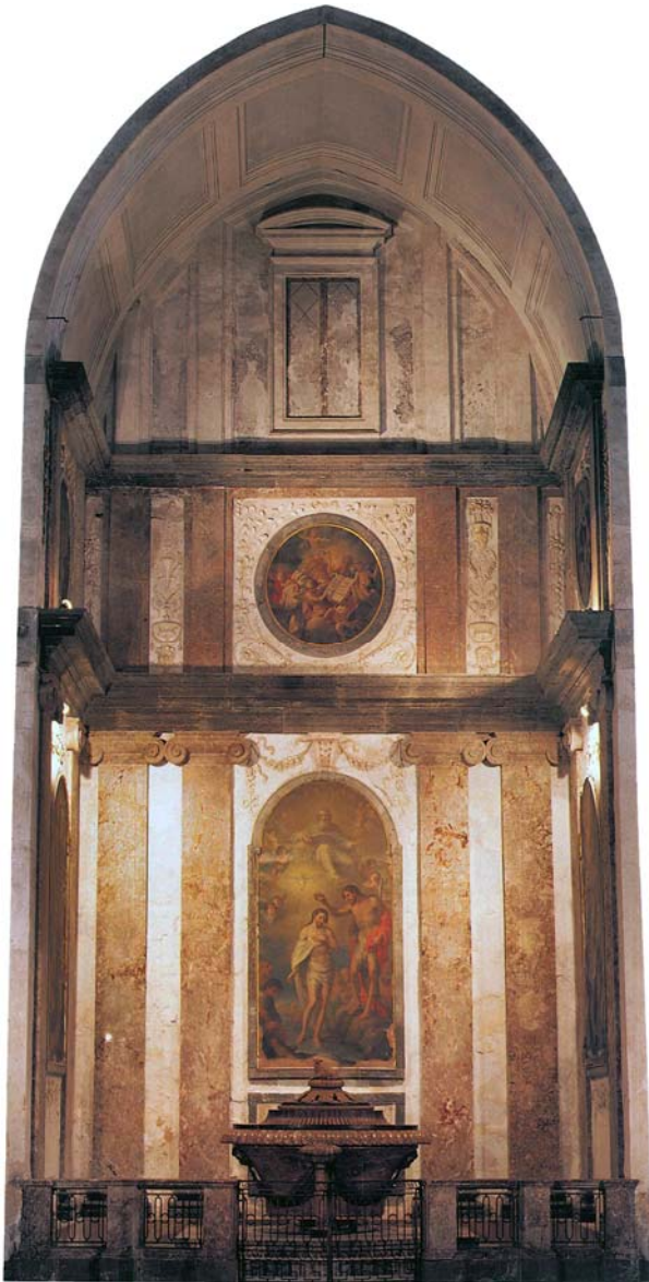
Figura 11. Vista general de la Capilla Bautismal de la Catedral de Mallorca.

Clodoveo” de José Vergara, dispuesto en el lado derecho. Además, el baptisterio está decorado también con tres tondos al óleo, ubicados en la parte superior de cada cuadro de altar, y que podrían haber sido realizados por los mismos artistas. Estos lienzos ilustran los tres estados del alma: antes de recibir el bautismo, durante el momento de recibirlo y después de ser cristianado.