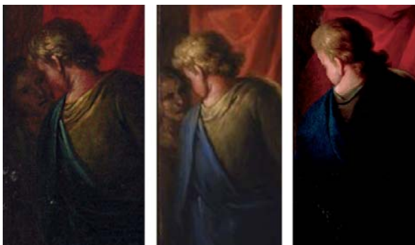
Figura 9. Detalle del personaje presente en los dos modelinos.

Finalmente, hay destacar otra variación que se produce en comparación con los modelinos. Se trata de un personaje en segundo plano ubicado en la esquina inferior izquierda, concretamente situado al lado del niño que sujeta el paño blanco con el que secan al neocatecúmeno durante el rito del bautismo. Dicho individuo aparece en sendos modelinos, pero no se encuentra en el cuadro de altar, dando a entender que el pintor valenciano lo acabó eliminando de la composición final.