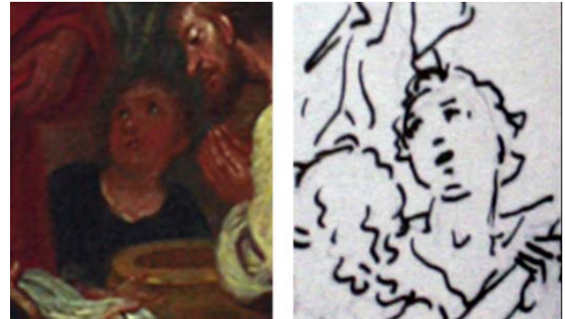
Figura 3. Niño portando la pila bautismal del modelino basado en uno de sus bocetos.

disposiciones muy similares entre sí o que mantienen bastantes elementos en común. Por otro lado, se puede distinguir la reproducción de personajes, ya que es usual localizar individuos secundarios comunes para completar las multitudes de gente de las escenas, resultando una fórmula identificativa de la producción del pintor valenciano, tal y como se puede comprobar en el modelino objeto de estudio.