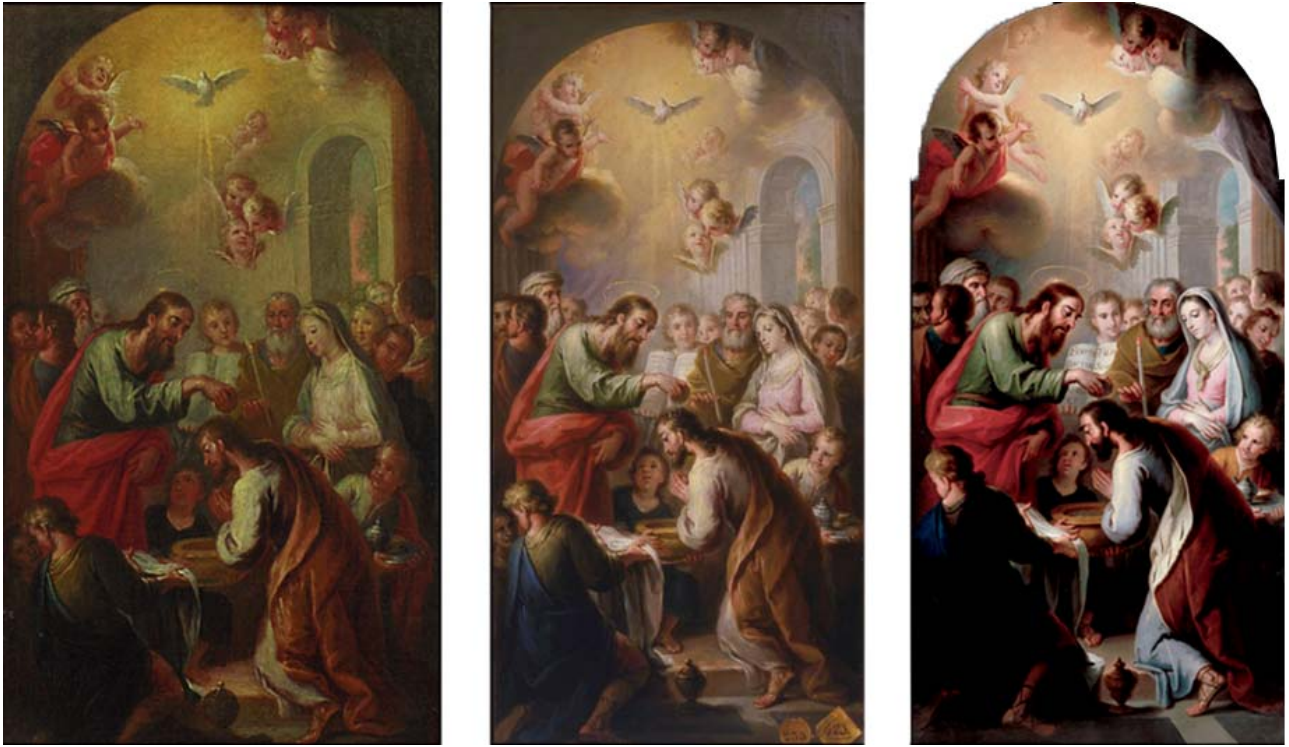
Figura 5. De izquierda a derecha: modelino de colección particular (62,5 x 37 cm), modelino ubicado en la Academia de Bellas Artes de San Fernando de Madrid (60 x 33 cm) y cuadro de altar de la Catedral de Mallorca (296 x 149 cm).

obras, además de poder definir que el modelino estudiado es un boceto pictórico original y no una copia como podría pensarse en un inicio. Se trata concretamente de un personaje que no aparece en la obra objeto de estudio pero que, sin embargo, sí se presenta en el de la academia madrileña. El individuo en cuestión está ubicado en el grupo de personas del centro de la composición, entre el joven que sujeta el libro bautismal y el anciano con la vela sacramental en la mano. Dicho personaje inexistente en nuestra obra aparece también en el lienzo de gran formato de Mallorca, por lo que es muy probable que José Vergara realizara primeramente el esbozo estudiado y creara posteriormente el ubicado en Madrid, al que añadiría la figura mencionada. Finalmente, ejecutaría el lienzo del baptisterio con la composición del último modelino.