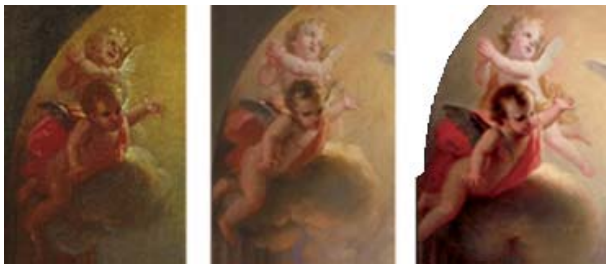
Figura 7. Detalle de la adición de las piernas del ángel en el cuadro de altar.

ángeles ubicado a la izquierda del rompimiento de gloria, probablemente añadidas en el cuadro de altar con el objetivo de completar la composición del personaje.