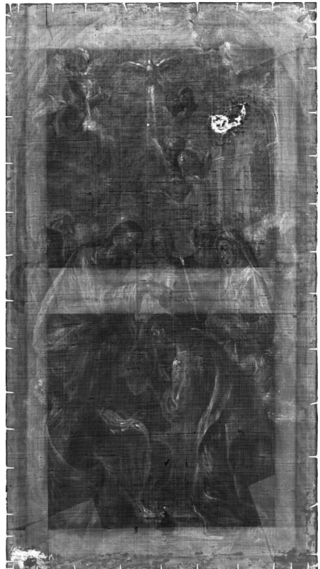
Figura 12. Radiografía del modelino realizada en el laboratorio de Rayos-X del Departamento de Conservación y Restauración de Bienes Culturales de la Universidad Politécnica de Valencia.

Asimismo, nos encontramos ante una obra con un buen estado de conservación debido a que presenta una intervención anterior, probablemente realizada entre finales del siglo XIX y principios del XX, de la cual destaca principalmente el entelado que se le realizó al soporte original con tela de lino. Además, gracias a la información obtenida de la radiografía, se conoce que en esta última restauración se estucaron unas lagunas ubicadas en la esquina inferior izquierda y en la zona derecha de la representación de la parte celestial.