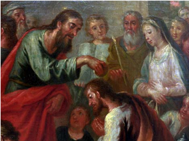
Figura 2. San Remigio bautizando a Clodoveo ante la presencia de su mujer Clotilde, detalle del modelino.

Así pues, examinando con detenimiento la escena representada en el pequeño modelino, se pueden identificar fácilmente los tres personajes principales que toman partido en este acto: San Remigio, el rey Clodoveo y su esposa Clotilde.