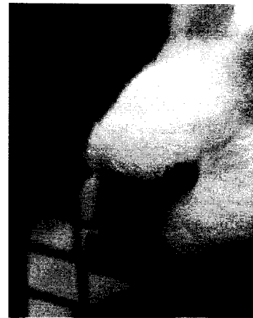
Atteinte par Trichophyton mentagrophytes

Elle débute par une plaque érythémato-squameuse circulaire qui se tuméfie, rougit, suppure et fait tomber les poils. L'inflammation est violente. Le prurit existe parfois. Le kérion réalise un macaron inflammatoire surélevé et bien délimité de quelques centimètres. Les orifices folliculaires sont dilatés et purulents. Au bout de quelques jours, la suppuration se tarit, les signes d'inflammation s'amenuisent et cette amélioration clinique s'accompagne d'une repousse des poils au centre de la lésion. Ces teignes sont souvent dues à