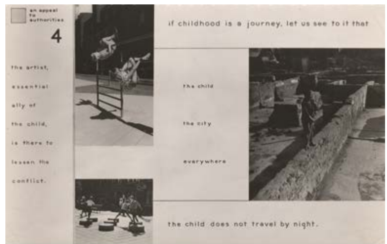
Figuras 2, 3, 4 y 5: Rejilla o paneles (grid) de Aldo van Eyck para el X CIAM de Dubrovnik (1956). Un buen ejemplo de la importancia dada al usuario (un usuario especial en este caso: el niño) en la arquitectura del Team 10.

de mejorar los modos de vida de las personas a través de un trabajo comprometido con las necesidades (físicas y espirituales) de los futuros usuarios. En este sentido, si algo caracteriza —e ilustra— el discurso común del Team 10, es que sea cual sea la intervención arquitectónica propuesta, debe estar inspirada en las características concretas de esos usuarios, alentándoles así a que satisfagan sus propias aspiraciones personales (y no sólo las del arquitecto).