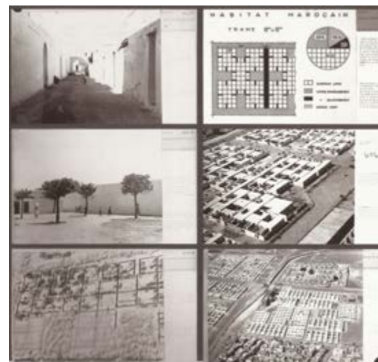
Figura 1: “Habitat du plus grand nombre Grid”. Imagen parcial de la información gráfica presentada en el IX CIAM de Aix-en-Provence (1953).

Con todo, el origen de la diversidad de iniciativas arquitectónicas acometidas por el Team 10 reside en el talante común compartido por todos sus miembros, expresado sin fisuras a partir fundamentalmente del discurso teórico esencial. En la medida que son los textos más propositivos los que en cierto modo condensan tal actitud, es también ahí donde se concentran los verdaderos rasgos distintivos del grupo, siendo el participado concepto de dimensión humana de la arquitectura el componente esencial del pensamiento latente. Teniendo en cuenta que la mayoría de publicaciones se ocupan de profundizar sobre las diferentes individualidades que integraban este heterogéneo colectivo (con notables excepciones como el libro de Max Risselada y Dirk van den Heuvel “Team 10: 1953-1981. In search of a Utopia of the Present” [3]), y con mayor profusión sobre la obra construida,