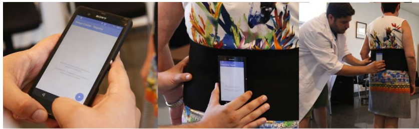
Figura 2: Preparación de la prueba FallSkip.

El dispositivo de medida, ubicado en la zona lumbar del paciente (Figura 2), registra las aceleraciones generadas por el movimiento del paciente a lo largo de la prueba. A partir de la aceleración medida, el sistema realiza una segmentación de las fases de la prueba y una parametrización para calcular las variables biomecánicas asociadas al riesgo de caídas: