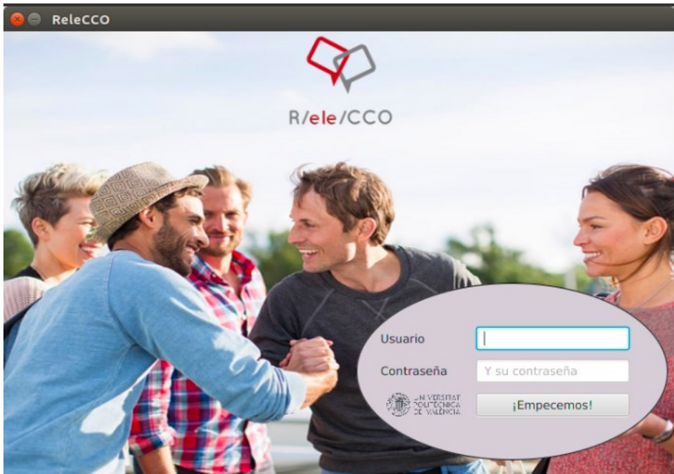
Imagen 1: R/ele/CCO

derechos de autor que focalizan desde el primer momento el proceso de auto aprendizaje de la conversación en el recurso.