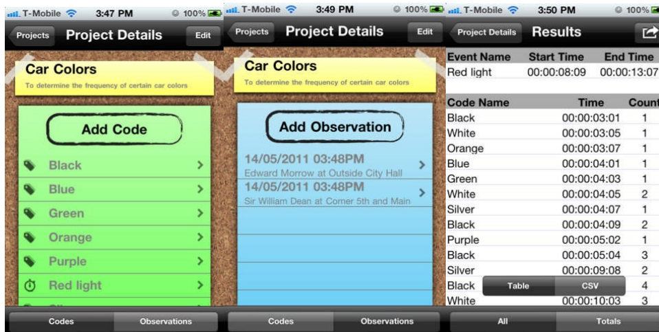
Fig. 2 Apps para la observación directa y participante.

Del segundo grupo destacan aquellas aplicaciones que hacen uso del sistema de geolocalización o GPS del dispositivo móvil con el fin de cruzar los datos provenientes de las percepciones con coordenadas temporales (horas y segundos) y espaciales (posición X e Y). Con carácter general, se emplean desde postulados teóricos situacionales que analizan y explican el fenómeno delictivo otorgando relevancia al factor ambiental, como serían los estudios con mapas del delito (Vozmediano y San Juan, 2010). o mapping crime . En este sentido, destaca la aplicación FOCA 6 desarrollada por la University College de Londres. La herramienta permite recopilar datos que “proporcionan una idea de cuándo y dónde se experimenta miedo a la delincuencia, y por quién”.