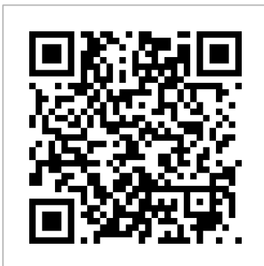
Ilustración 3: Código QR para acceder a los 12 comentarios aclaratorios acerca de las RAV realizados por los organizadores de las mismas.

- Con fines divulgativos, se ha generado un documento online con cada una de las respuestas hasta ahora recibidas que se puede consultar en: ver código QR más abajo (ilustración 3).